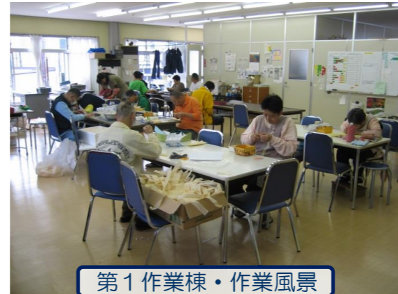
第1作業棟・作業風景

＜建物＞ 第1作業棟—上松町より無償貸与 ストックヤード、第2作業棟—法人所有 ＜土地＞ 借地 (上松町が地代の半額補助)