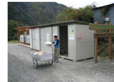
上松町リサイクルセンター