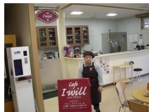
上松町公民館内 Cafe I will