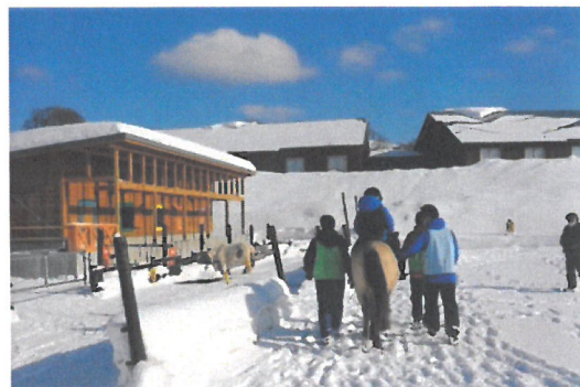
「雪が積もった馬場での乗馬体験」