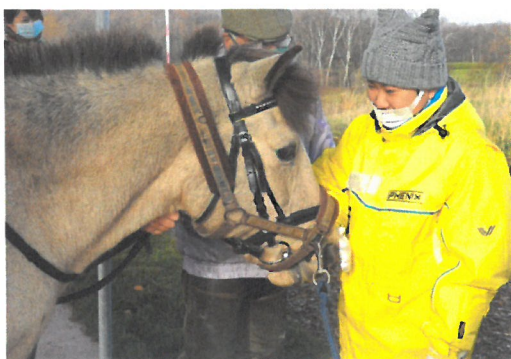
「乗馬後の馬のふれあい」

11月上旬、秋に、宿泊を伴うキャンプを1回開催。小児がんとたたかう子どもと家族(茨城県在住1家族4名)を、主治医同行のもと、2泊3日で招待した。家族一緒に乗馬や森たんけん、アーチェリー、焚き火でおやつ作りなど、北海道の自然を満喫してもらった。