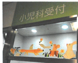
「病院で貼られたステッカー」

北海道に棲む動物を描いた、貼ってはがせるウォールステッカーをオリジナルで 500 セット製作。全国各地の協力小児科医(病院)へ郵送し、病室の子どもたちと楽しんでもらいました。