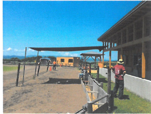
「馬場にコンテナ、日陰シェードを設置」