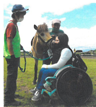
「乗馬後の馬とのふれあい」

緊急事態宣言解除後の 6 月から 10 月までのあいだ、キャンプ場の近隣にある滝川市子ども発達支援センター、旭川子ども総合療育センターの利用者を中心に、1 家族限定の日帰りデイキャンプを週末 12 回開催し、12 家族 47 名の子どもたちや家族に、馬アクティビティや森のたんけん、芝生あそびなどを楽しんでもらいました。また、1 月下旬にも、1 日 1 家族限定のデイキャンプを週末 2 回、雪の中で開催し、北海道内在住の 2 家族 7 名を招待しました。