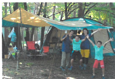
「キャンプ気分を楽しむ家族」

これまで全国各地からキャンプに参加した、1000名を超える子どもたちや家族へ、コロナ禍見舞い(お便り)を送付。その中で、ギフトの募集を行い、希望者にはキャンプ用品をプレゼント。おうち時間が長くなったタイミングで、安全にキャンプの雰囲気を感じてもらいました。