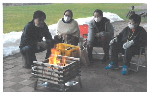
「家族みんなで焚き火おやつ」

秋には、宿泊を伴うキャンプを 1 回開催しました。小児がんとたたかう子どもと家族(茨城県在住 1 家族 4 名)を、主治医同行のもと、2 泊 3 日で招待することができました。家族一緒に乗馬や森たんけん、アーチェリー、焚き火でおやつ作りなど、北海道の自然を満喫してもらいました。