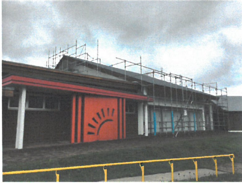
「食堂・浴室棟の大屋根のペンキ塗り替え」

主要施設群(食堂&浴室棟、宿泊棟2棟、医療棟(ほけんしつ)、事務棟、ゲストハウス、おあずまや、倉庫棟)を管理するとともに、車いすで行けるツリーハウスや森、草地の維持管理を継続実施。施設利用者が安全で快適に過ごせるよう、適時必要な施設設備の設置や軽微な改修を行った。特に本年度は、食堂・浴室棟および宿泊棟2棟の屋根の塗り替えを2ヶ月間かけて実施し、セラピー馬がキャンプ中に滞在するための馬房施設の充実を図った。