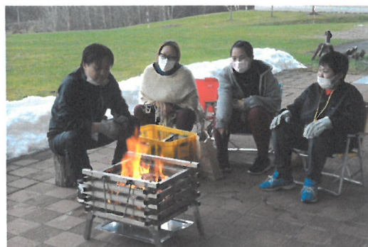
「家族一緒に焚き火おやつ」