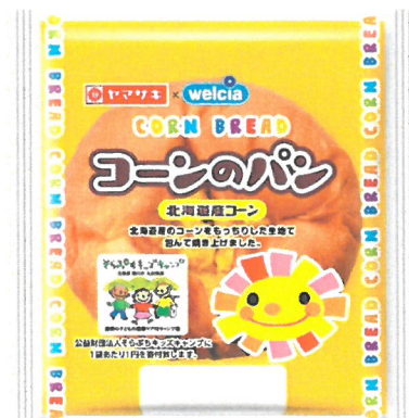
「チャリティ菓子パン」