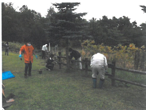
「屋外維持管理ボランティア(ペンキ塗り)」