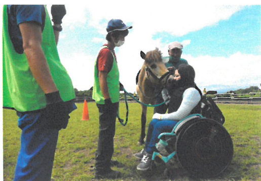
「乗馬後の馬のふれあい」

また、1月下旬にも、1日1家族限定のデイキャンプを週末2回、雪の中で開催し、北海道内在住の2家族7名を招待した。