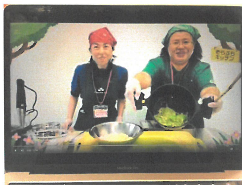
「食事班によるレシピ紹介動画配信」