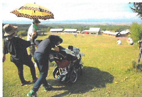
「見晴らしの丘からみた専用施設群」