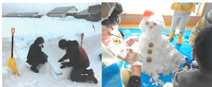
「雪の積もらない地域の小児病院のプレイルームで雪だるま作り」

雪の積もらない地域にある小児病院や闘病中の自宅へ、キャンプ場に積もった雪を専用のスノーボックスに詰め、冷凍空輸で贈りました。初めて雪に触った子どもたちも多く、とても喜んでくれました。