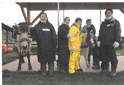
「家族一緒に馬と記念撮影」