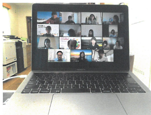
「ボランティア情報交換会(オンライン)」

代わりに、既存登録者とはWEB会議ツールを使って、「オンラインでの情報交換会」を定期開催し、今後も継続することとした。また、今後は「SNSのフォロワーとしての登録」を呼びかけ、SNSを通じて、活動の情報発信への賛同の表明行動(いいね等)や、不定期に依頼する遠隔でのボランティア活動(チャリティ商品のPRや購入等)への参画を依頼していくこととした。