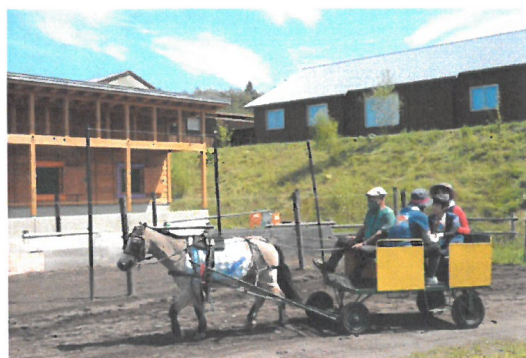
「家族一緒に馬車体験」