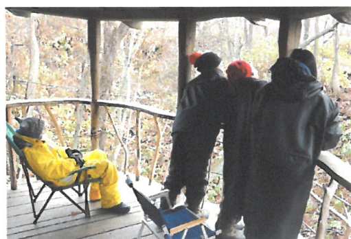
「森たんけん(ツリーハウス見学)」