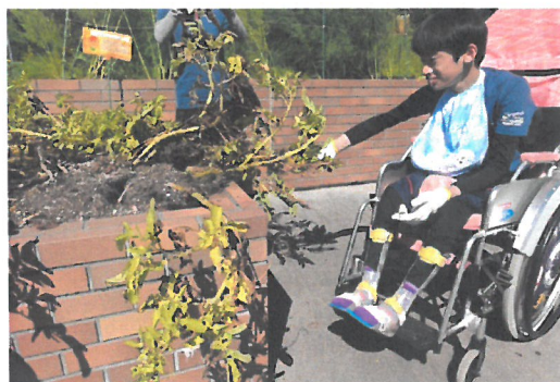
「レイズドベッド(立体畑)でのじゃがいも収穫体験」