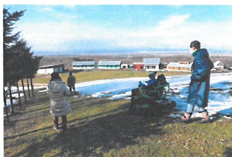
「見晴らしの丘登山(前年度の宿泊キャンプ)」