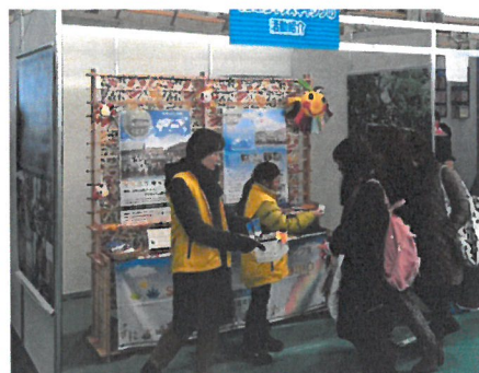
「イベント展示ブース出展での PR」