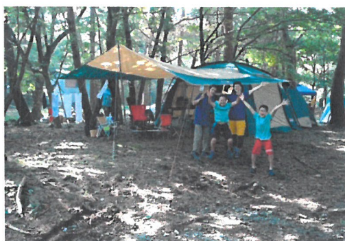
「自宅近くの公園でキャンプ用品を活用」