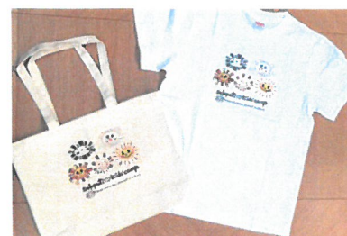
「グッズ(エコバック・T シャツ)」

→闘病中の子どものイラスト入りエコバック・T シャツ等を製作・配布。 協力：ワイズコーポレーション