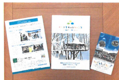
「アニュアルパンフレット他」

付加価値のあるグッズ寄贈を受け、WEB 上で寄付投票を行う。 →8 月ドラッグストアショーで試行予定