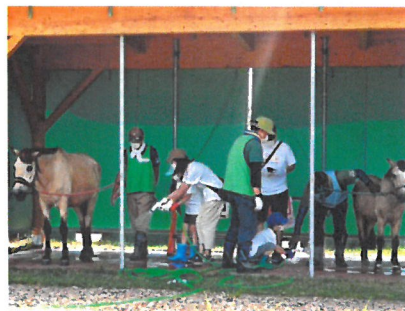
「馬のお世話(前年度の日帰りキャンプ)」

(本年度は、滝川市こども発達支援センター、道立旭川子ども総合療育センター、北海道難病連、北海道大学病院他へ相談予定)