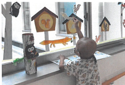
「ステッカーで入院中の病院を飾り付け」