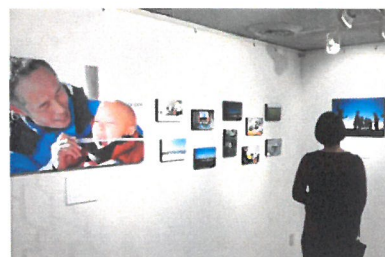
「キャンプの様子を伝える写真展」