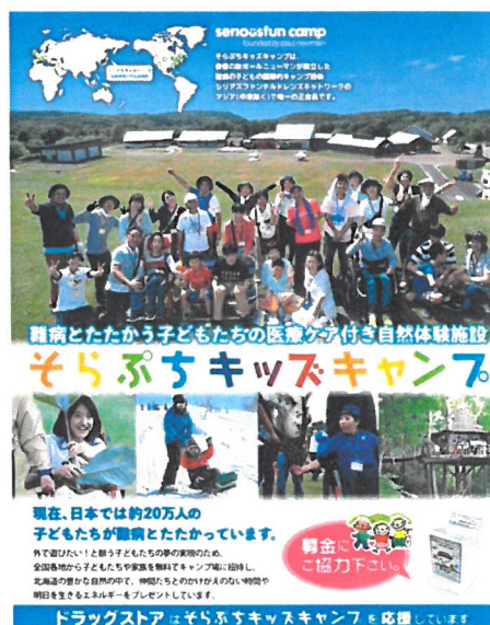
「店頭募金箱用ポスター」