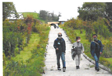
「キャンプ場一般公開イベント」

→本年度は、WEB を活用し遠隔の病室や自宅にイベントの映像配信を試行（協力：ウルトラマン基金）