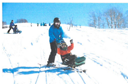
「場内ゲレンデでのシットスキー(過年度)」