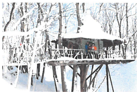
「車いすで行けるツリーハウス(冬)」