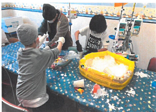
「小児病院内での雪遊び(スノーギフト)」

北海道に生息する動物を描いた、貼って剥がせるウォールステッカー。 協力:DADWAY