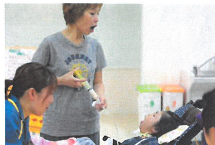
「流動食などにも対応する食事提供」