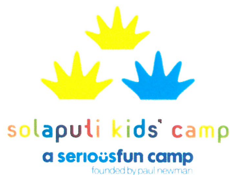
シリアスファン加盟により、新しいロゴになりました