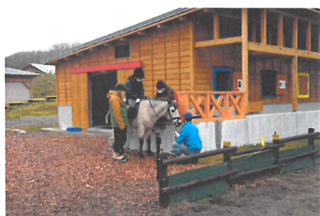
「乗降用スロープ付馬房施設(前年度)」