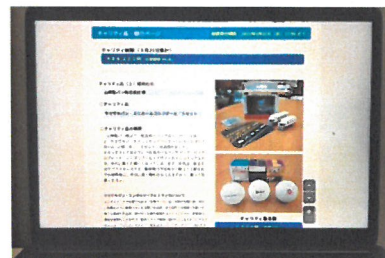
「WEB チャリティオークション」

スマホ閲覧、SNS 連動の改善、英語版の充実、クレカ及び電子マネー決済の対応、リアル事業等と連動したWEB パーク、WEB チャリティショップの企画検討他