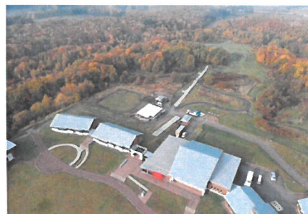
「建物群と森林・草地(16ha)」