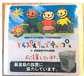
「店頭募金箱用シール」