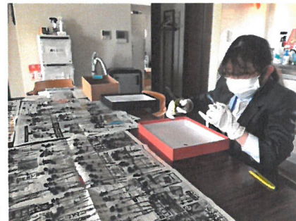
「元キャンパーのインターン」

免疫が低いことなどで、行動に制限がある元キャンパー(成人)に対し、積極的にキャンプ場でインターンとして受け入れ、就労体験の機会を提供する。