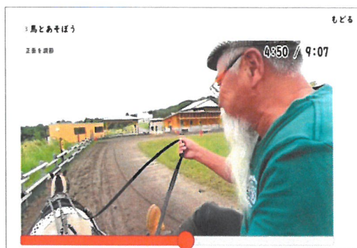
「制作した馬車操縦のVR映像」