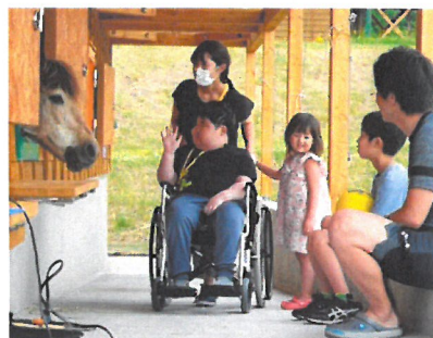
「馬ふれあい(前年度の宿泊キャンプ)」

(本年度は、国立がん研究センター、聖路加国際病院、国立国際医療研究センター、東京医科歯科大学病院、成田赤十字病院他へ相談予定)