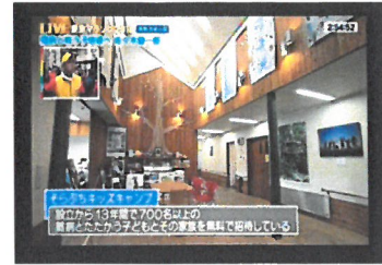
「東京マラソン関係でのテレビ放映」

キャンパー及び家族の心情に配慮しつつ、知名度を上げるため、テレビや新聞、雑誌等マスメディアへの積極的な露出を図る。(→本年度は未定)