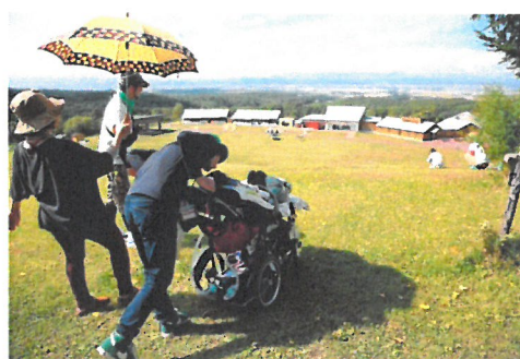
「キャンプ場内・見晴らしの丘からみた建物群」

本法人は難病小児を主たる対象とする自然体験施設の運営に関する事業を行い、難病小児とその家族の「QOL（生活の質）」の向上や、心のケアに寄与することを目的とする。