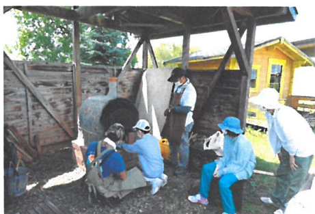
「石窯でのピザ作り(前年度の宿泊キャンプ)」

上記2種類のファミリーキャンプを、感染症対策を徹底しながら、開催するとともに、今後の展開を想定し、キャンプの年間実施回数や各キャンプの参加人数を増やした場合の適正な実施体制や運営手法の検討もあわせて行う。