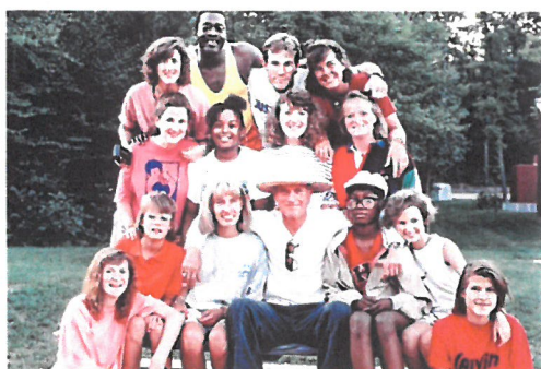
キャンパーたちと故・ポールニューマン氏 (中央)

シリアスファンは、ハリウッド俳優、故・ポールニューマン氏が米国に創設した、難病の子どもと家族のための医療ケア付キャンプの世界的なネットワークであり、そらぶちは、アジア（中東を除く）初の公認キャンプ場となります。シリアスファンでは、定期的な現地審査と書類審査により、世界基準の安全性とサービスの質の認定を行っており、そらぶちは、2016年11月より正会員として加盟しています。