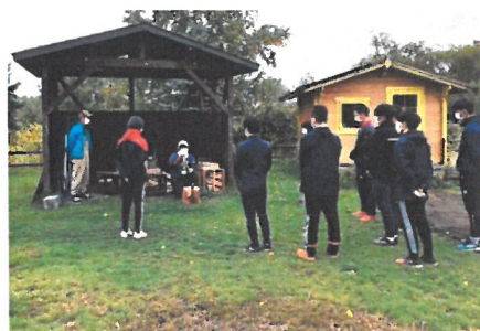
「連携大学による維持管理ボランティア」

学生等のインターン(無償・有償)については、人数や時期を限定、感染対策を徹底した上で、必要に応じて受け入れを行うこととする。(新卒の正職員採用をする際には、夏季インターンを必須条件とする。)