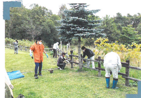
団体ボランティアによる維持管理作業