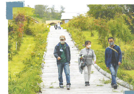
一般公開でのキャンプ場内見学