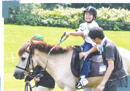
車いすユーザーのセラピー乗馬