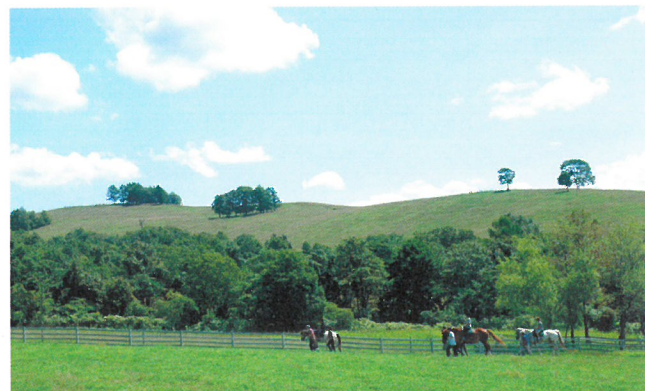
北海道滝川市丸加高原

難病とたたかう子どもたちが自分の病気や治療のことを気にせず遊べるよう、特別に配慮された医療ケア付自然体験施設をつくりたい！