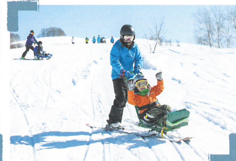
車いすユーザーのチェアスキー