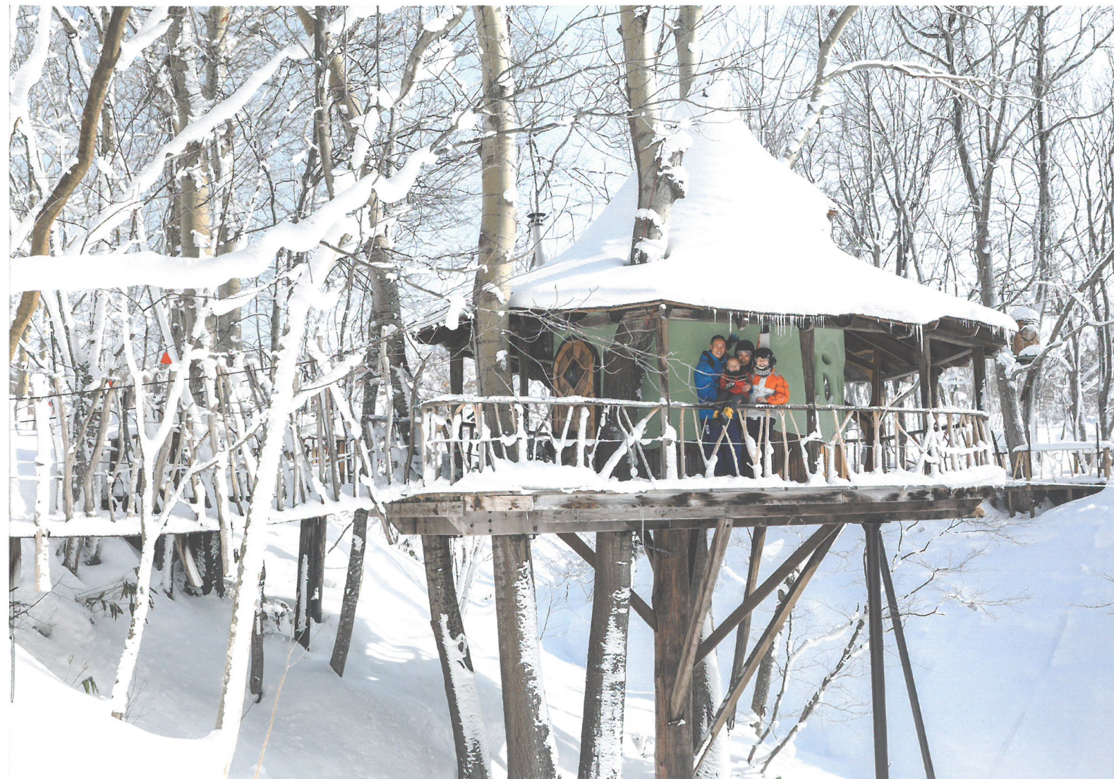
きつつきの森・車いすのままで行けるツリーハウス