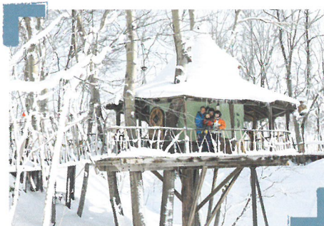
吊り橋付ツリーハウスの定期改修