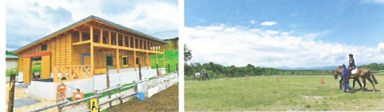
うまの家・うまの広場