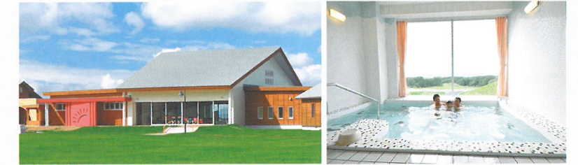
協力：民間寄付金等

【食 堂】100人が集える食堂ホールです。食事時間以外は、室内遊び場としても利用します。 【大浴場】森と空をテーマにした2つの浴場があります。キャンプの仲間と一緒に入ることができます。