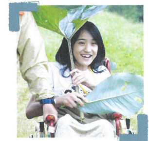
2021年度より元キャンパーが就労チャレンジ

また、難病児支援の分野を人材の面でも発展させるため、この分野に関心のある大学生を積極的にキャンプ場でインターンとして雇用する。