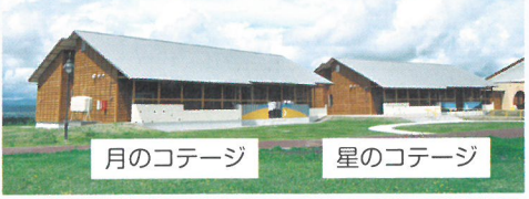
協力：公益財団法人日本財団(宿泊棟1)、一般財団法人日本メイスン財団(宿泊棟2)