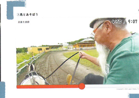
制作した馬車操縦のVR映像