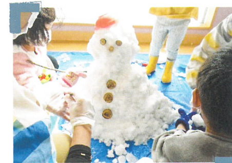
小児病院内で雪だるま作り