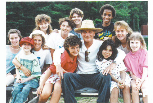
キャンパーたちと 故・ポールニューマン氏 (中央)