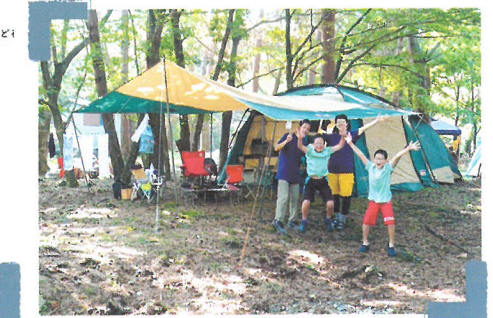
自宅近くの公園でキャンプ