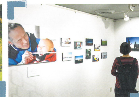
キャンプの様子を伝える写真展