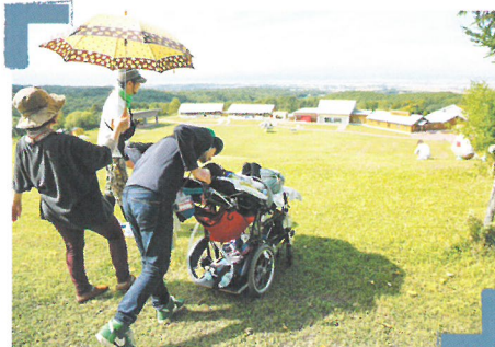
家族で見晴らしの丘へ登山