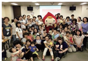
愛知県春日井市で開催した 防災ママカフェの様子

SSPJでは、特別講師を全国の学校、地方自治体等に派遣し、「自分と大切な人のいのちを守る」教育プログラムを、講演やワークショップ形式で提供。講師は東日本大震災経験者、防災について一定の教育知識を持つ者で、1回30~100人のワークショップ、100~500人の講演・イベント等を年間100回以上実施しています。講演後、参加者の皆様に「この話を家族や友人に伝えたい」「すぐ行動にうつしたい」と思っただけの心に響くコンテンツは、あたらしい未来を拓く防災教育として、多数のメディアに取り上げていただいています。