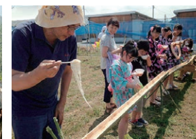
南相馬市の仮設住宅での夏祭りをお手伝い(ふんばろう福島プロジェクト)