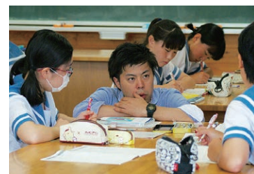
熊本コラボ・スクールで、熊本地震で被災した子ども達に安心して勉強できる場所と時間を提供(NPOカタリバ)