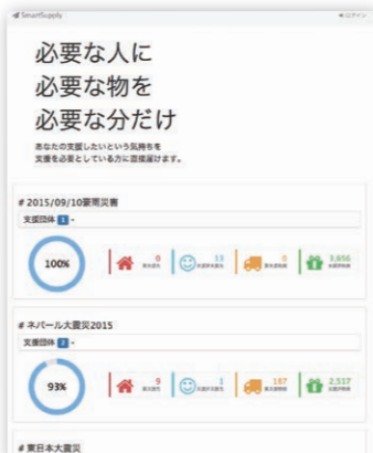
スマートサプライのウェブサイト

「スマートサプライ」とは、東日本大震災の際に、3000か所以上の避難所・仮設住宅・個人避難宅エリアを世界中から継続的にサポートすることを可能とした、ふんばろう東日本支援プロジェクトの物資支援方法をバージョンアップさせた仕組みです。