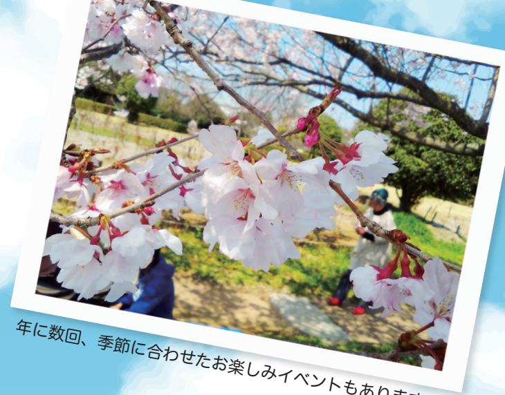
年に数回、季節に合わせたお楽しみイベントもあります。

ネリアではどんな一日を過ごすのか… ここでほんの少しだけ一日の様子を紹介させていただきます。