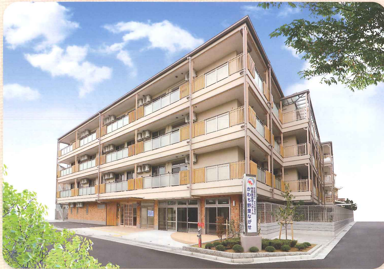
鉄骨4階建て、特養60室、ショートステイ20室。 木や土を使い日本の風土に適した『人に優しい建物』です。