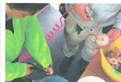
収穫後の清掃と選別