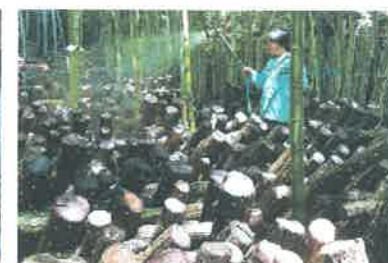
ホダ木の保湿管理作業