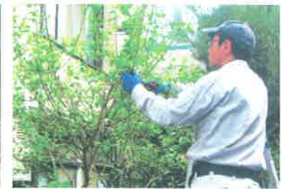
一般家庭の庭木剪定