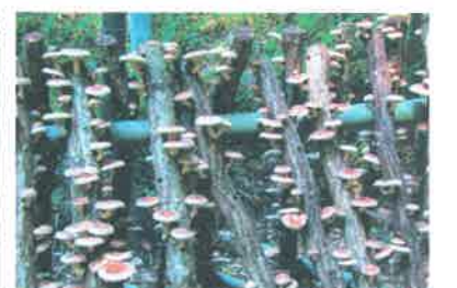
ホダ木に育った収穫前のしいたけ