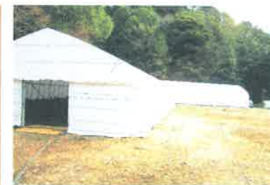
再度山作業所のしいたけハウス