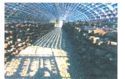
ハウス内に並ぶ しいたけホダ木