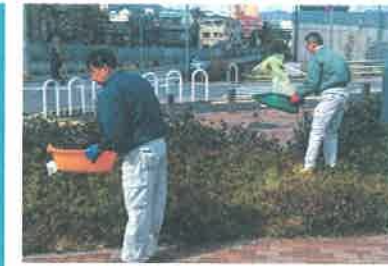
歩道の植え込み清掃