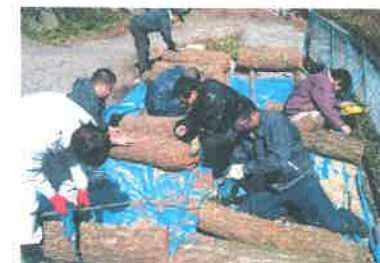
ホダ木に種菌の植え付け作業