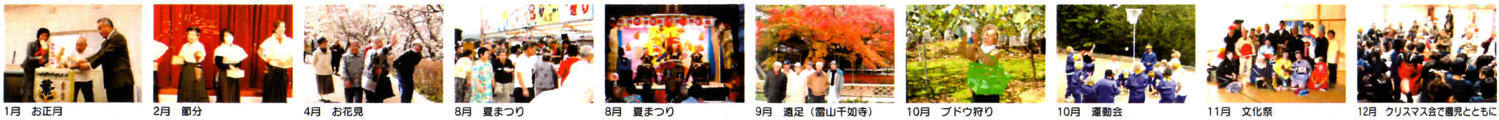
1月 お正月 2月 節分 4月 お花見 8月 夏まつり 8月 夏まつり 9月 遠足（雷山千如寺） 10月 ブドウ狩り 10月 運動会 11月 文化祭 12月 クリスマス会で園児とともに