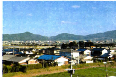
荘の南側から糸島市を望む