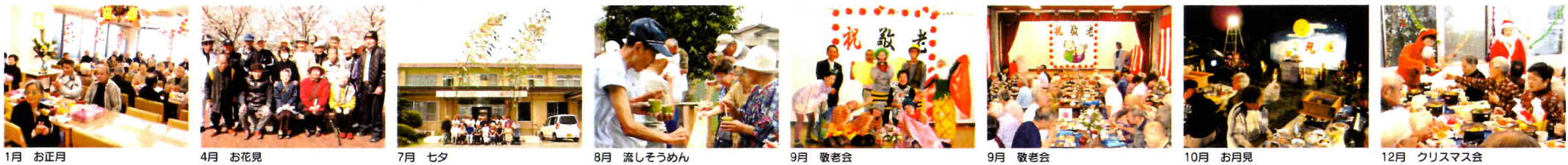
1月 お正月 4月 お花見 7月 七夕 8月 流しそうめん 9月 敬老会 9月 敬老会 10月 お月見 12月 クリスマス会

師吉荘の一年 今まで住んでいたところで経験した、生活風習をそのまま体感できるよう、四季おりおりの楽しい行事を開催しています。