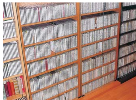
四十年代以後LPから移行して聴いてきたCD

も哀しみも、生も死も、怒りや争いも、この世のものを全て包み込むような世界だ。選歴から六年が過ぎようとしている今、振り返れば、子供の頃から周りに音があった。もの好きな父が当時としては珍しい大きな蓄音器を家に置いており、SPがかかっていた。「運命」の一部か何かだったのだろう。成長するにつれても、常に身近に音楽があったし、これからも音楽の無い生活は考えられない。以来、恐らく古今の名曲と言われるものは網羅的に聴いたであらう。凡そクラシックの範疇にあるものはジャンルを問わず演奏会に行き、LP、CDを収集して「名曲」を求めてきた。名曲は創られた時から存在しているから「名演」を求めていたのかも知れない。