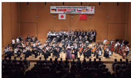
京都・国際音楽学生フェスティバル2012(フィナーレ)

このフェスティバルは一九九三年より毎年、開催しています。音楽を通じた国際交流と音楽家の育成を目的に、世界の音楽学校で学ぶ学生たちを毎年五月に京都に招き、二十回を迎えた二〇一二年まで、日本を含む世界二十か国から約二千三百名の音楽学生が参加しました。このフェスティバルの特色は、異なる音楽学校の学生同士がアンサンブルや