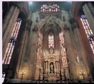
ミラノ大聖堂(ドゥオーモ)

因みにイタリアの国土が現在の形になったのは第一次世界大戦後のことである。(表紙:ミラノ)