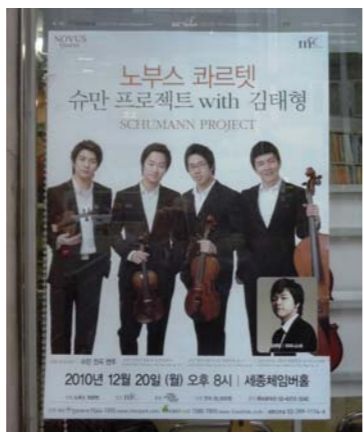
2010年暮、ソウルの世宗文化会館近くの音楽ショップ前に貼られたノブリスQ演奏会のポスター

ソウルがすっかり冬の気配となった二〇一〇年秋の終わり、訪れた世宗文化会館横の楽器店店頭でノブリスQのポスターが貼られていた。クリスマス頃の公演で、メインは