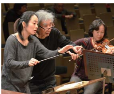
ROOMミュージックファンデーション音楽セミナー2012(指揮者クラス)

ROOMミュージックファンデーションの活動の基本は、音楽家の育成と音楽ファン(聴衆)の拡大です。これら双方が相まって音楽文化の普及と発展