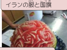
スイカに タイカービン