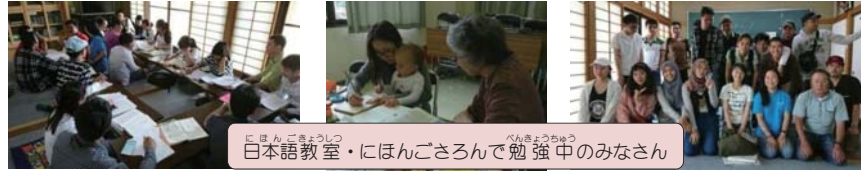
日本語教室・にほんごさろんで勉強中みなさん

日本語を勉強したい外国人の方のための教室です。 月曜日 メリーハウス 15:15-16:15 火曜日 甲田人権会館 13:30-15:00 水曜日 高客人権会館 13:00-14:00 土曜日 甲田ミュージアム 10:00-12:00 日曜日 吉田人権会館 14:00-16:00