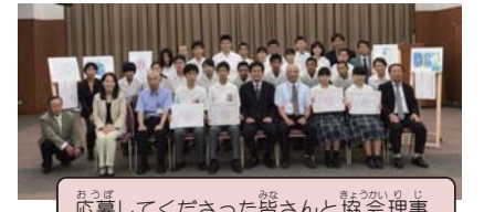
応募して下さった皆さんと協会理事

長年の夢であった協会の旗を掲げ外国人の方々の支援の在り方を改めて見直し、なお一層充実したものにと考えておりますので、皆様のお声をぜひお聞かせください。