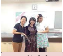
イランの服と国旗