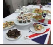
イギリス ティーパーティ