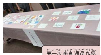
第一次審査通過作品

9月1日にクリスタルアージュにおいて、入賞者4人5点の作品を披露し表彰式を開催しました。下の写真は、表彰式の模様を撮影したものです。