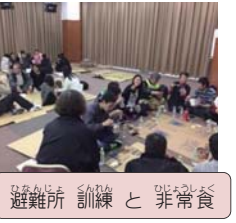
避難所訓練 と 非常食