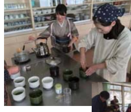
和の文化を楽しもう 1月

みんなで一緒に料理を作ったり、持ち寄りして楽しむパーティです。 8/20(日)は甲田町の絆でBBQをしました。 次は、12/16(土)クリスマスパーティです。ぜひ、コスプレをして参加してみてください。くわしいことが決まったら、ポスターでお知らせします。