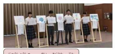
入賞者の4名と作品5点

9月1日にクリスタルアージュにおいて、入賞者4人5点の作品を披露し表彰式を開催しました。下の写真は、表彰式の模様を撮影したものです。