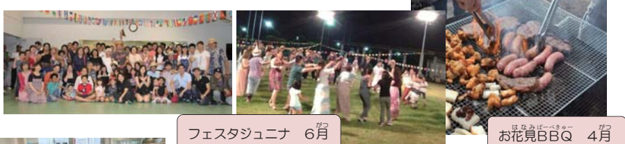
フェスタジュニナ 6月