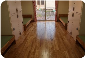
〔入居者居室（四人部屋）〕