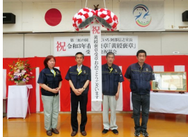
(加工班の皆さんと)