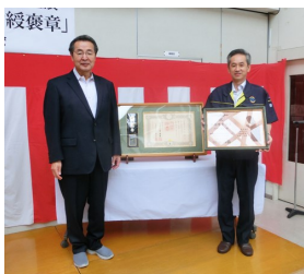
(左：湯村理事長 右：阿部室長)