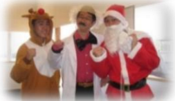
季節毎のパーティ