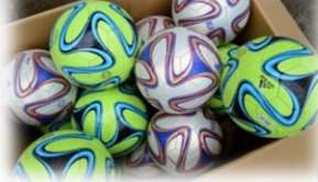
道具とユニフォーム