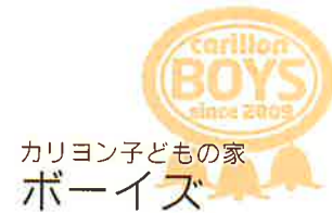
カリヨン子どもの家 ボーイズ