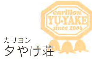
カリヨン タやけ荘