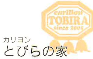
カリヨン とびらの家