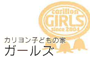
カリヨン子どもの家 ガールズ