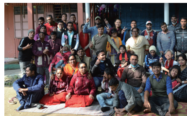
ラルシュ・マイメンシンの仲間たちと岩本ワーカー

新型コロナウイルス感染症拡大のため、バングラデシュ政府は2020年3月26日以降陸海空の国境を封鎖し、全国ロックダウンを指示した。これを受けラルシュの三つの家は、以後8カ月に及ぶ自主隔離に入った。国内経済は打撃を受け、貧困指数は10年前に逆戻りした。