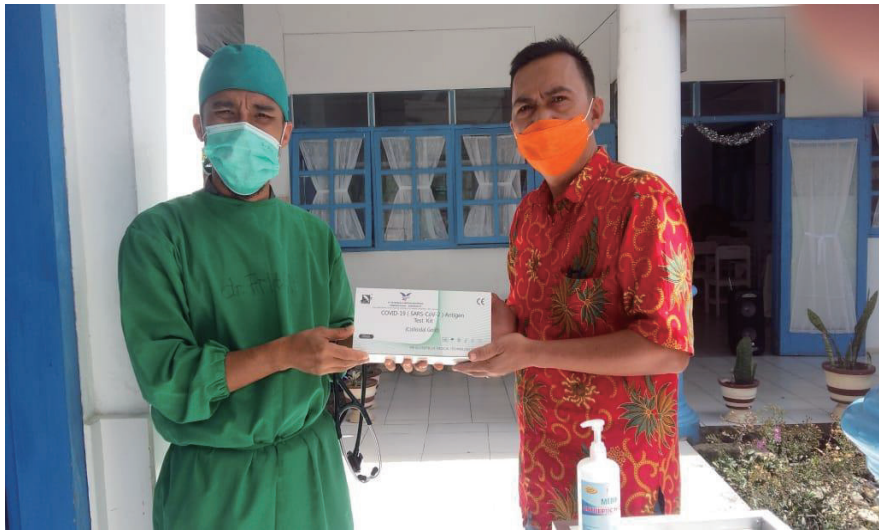
JOCS の支援で購入した衛生用品を手にするインドネシア シナルカシ病院の院長・元奨学生（左）とスタッフ（災害救援復興支援先）