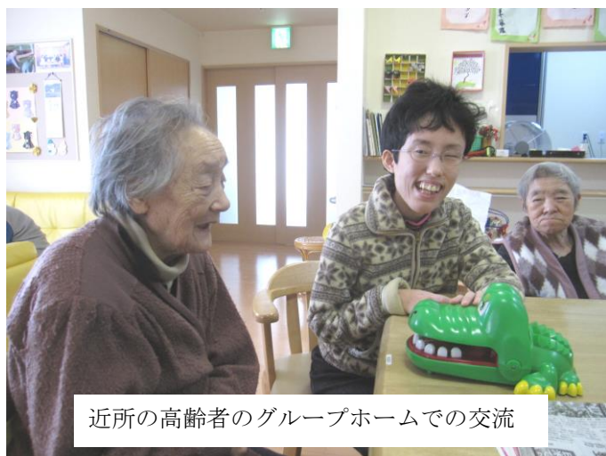
近所の高齢者のグループホームでの交流