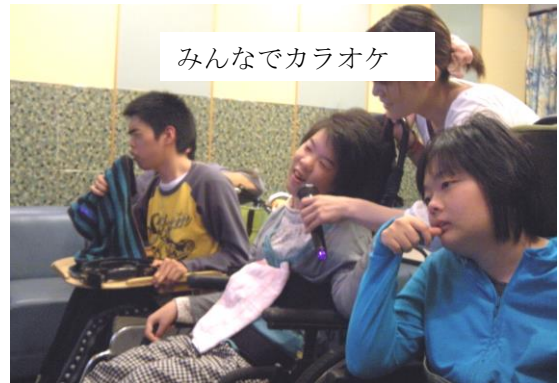
みんなでカラオケ

家族の負担を少しでも軽くし、障がいのある人と家族が安心して暮らせるように、自宅での食事や入浴などのお手伝いもしています。