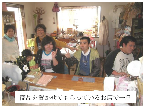
商品を置かせてもらっているお店で一息