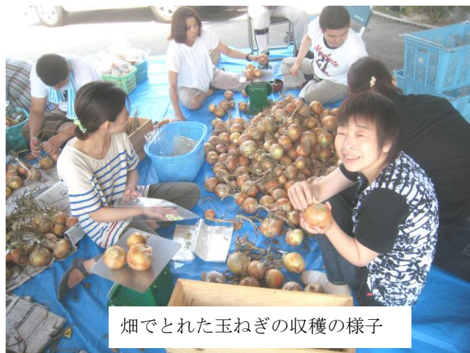
畑でとれた玉ねぎの収穫の様子