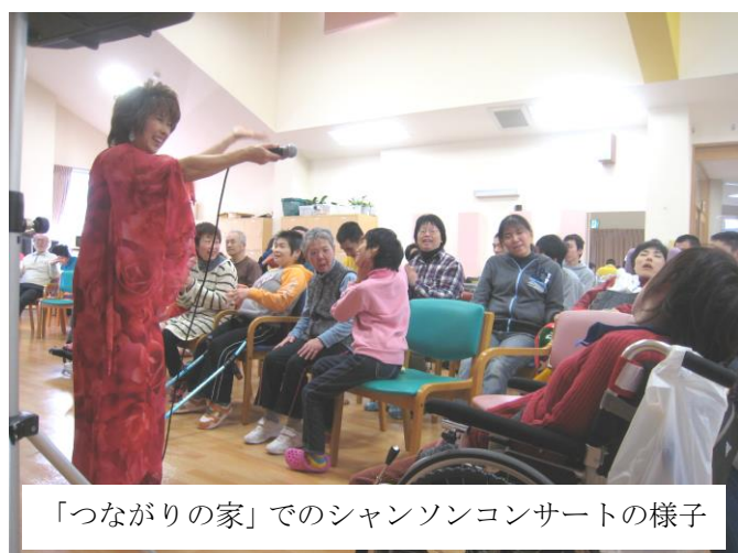
「つなぐりの家」でのシャンソンコンサートの様子

社会福祉法人ひびきは、障がいのある人が生まれ育った地域で、あたり前に社会生活が送れるように、障がいのある人と家族を支援、援助していきます。