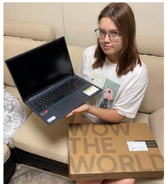
<PC を手にするウクライナ女性>

大分県に避難したウクライナ人に、大分の NPO 法人 Beautiful World を通じて、ロシア語・ウクライナ語に対応する 6 台のパソコンと日本の大学に入学するにあたっての補助金を支援。