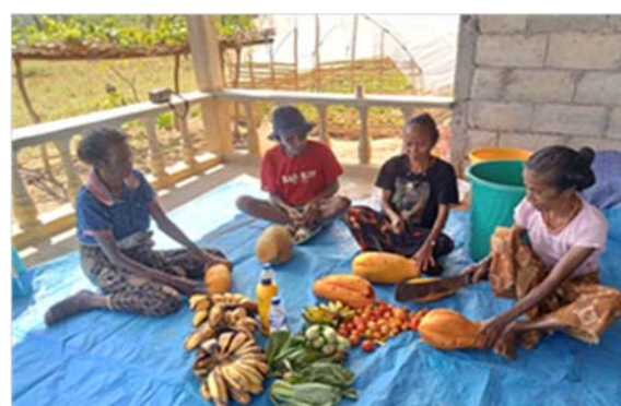
<有機液体肥料を作るメンバーたち>