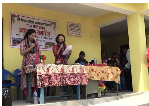
<「えがおホールディングス」が臨席する開所式>