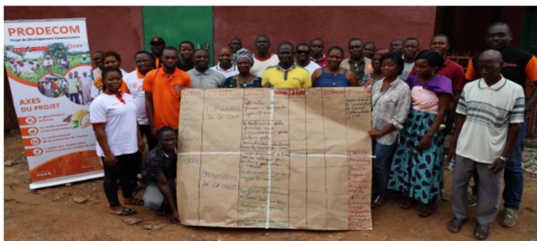
<CDCOM でアクションプランを策定>