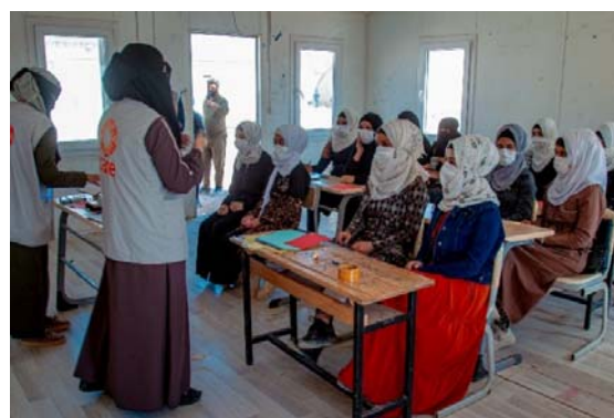
<心のケア/ライフスキルセッション>