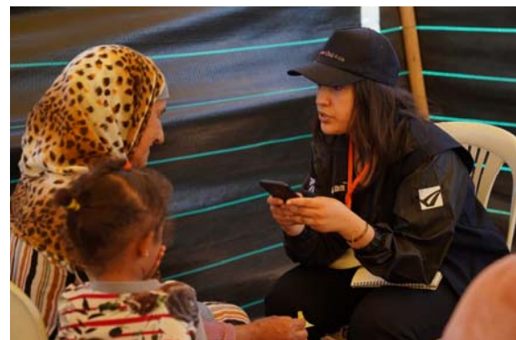
<女性に寄り添った支援>