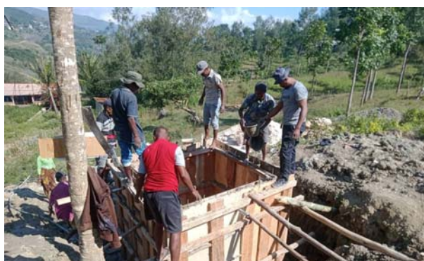
<貯水タンクの建造>

先行 N 連事業「エルメラ県アッサベ郡農業用水改善事業」での成果と課題を踏まえ形成された本事業は、以下の 2 つの成果を柱に、アッサベ郡内の他の 4 集落にて、2024 年 3 月 1 日に開始。