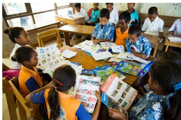
<ラファエック学習雑誌を手にする生徒>