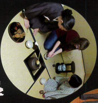
国際文化交流 JPA 石川県支部