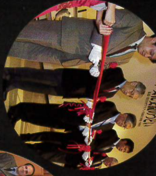
カザフスタンと国際文化交流会 後援：外務省 カザフスタン共和国大使館