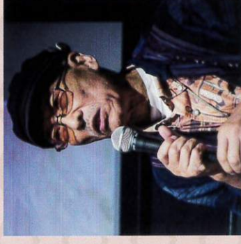
アニメ部 中嶋 興 映画監督 (映像作家)、アニメーション作家、 地域街おこしプロデューサー、日本書アニメの 会主幹、国際アニメ协会会员など多数