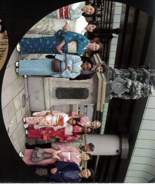
第3回日本文化塾 in 日本橋 着物で日本橋散策

一般社団法人 日本文化海外普及協会 〒104-0061 東京都中央区銀座 6-6-1 銀座風月堂ビル5F Tel. 03.6215.8421 Fax. 03.6215.8700 http://www.japan-pr.org jpa@japanpr.or.jp