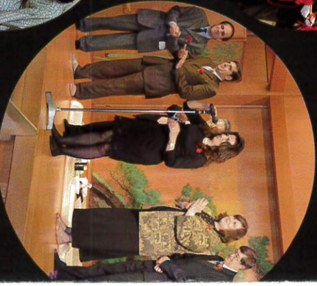
第1回日本文化塾 in TOKYO 参加大使館 8カ国