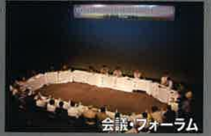
会議・フォーラム