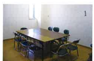
ミーティングルーム