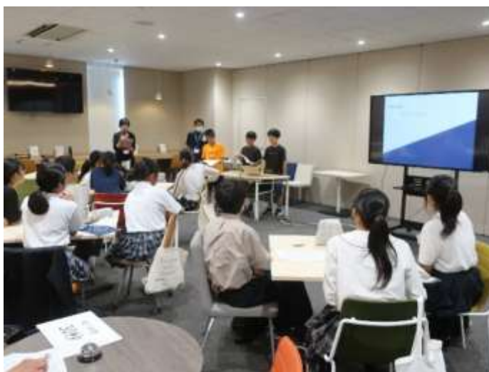
「KBS 京都放送で撮影された成果発表会」