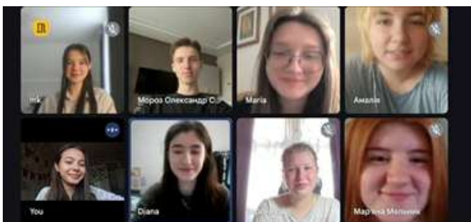
Lopatas チーム (ウクライナ)