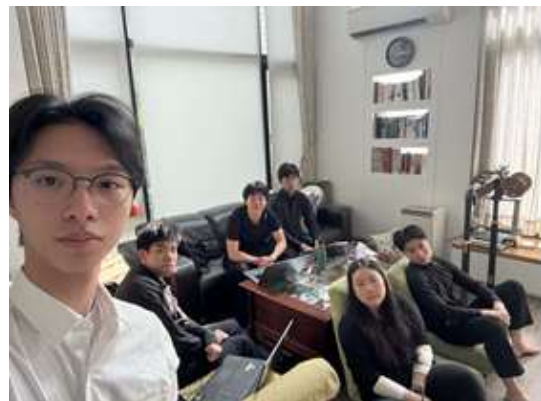
Visionary チーム (台湾)