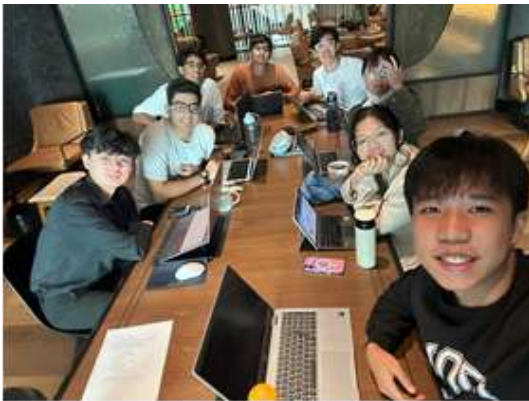
Dynamo チーム (シンガポール)