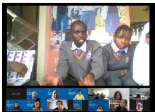
オンライン表彰式: ボツワナの生徒