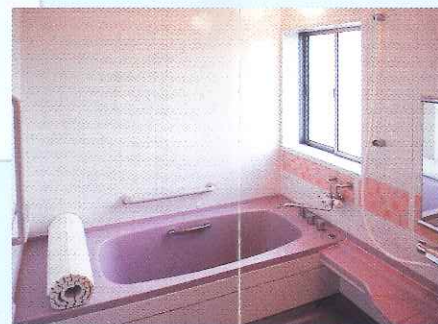
ゆったりと入れるお風呂