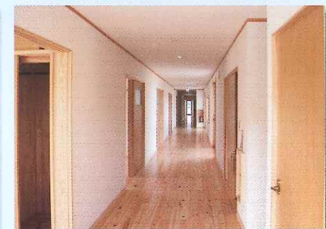
防音で滑りにくい廊下