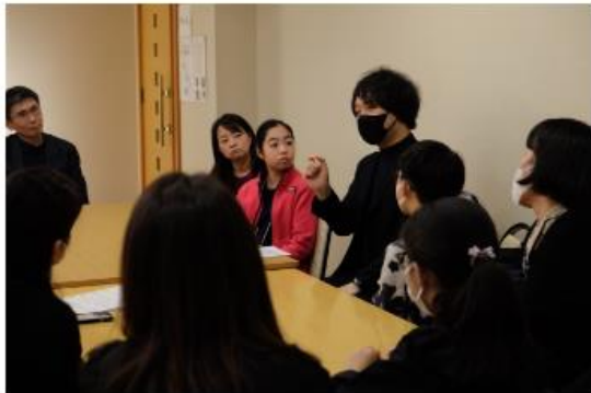
ソナタコンクールジュニア育成部門マスタークラスのアドバイス風景