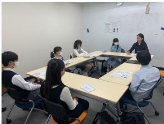
ソナタコンクールジュニア育成部門マスタークラスでの先輩トークコーナー