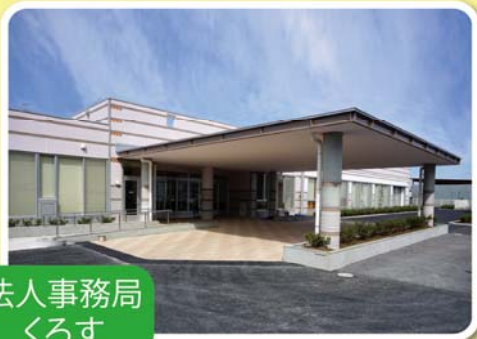
法人事務局 くるす