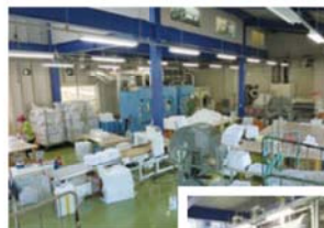
〔写真上〕乾燥室全景