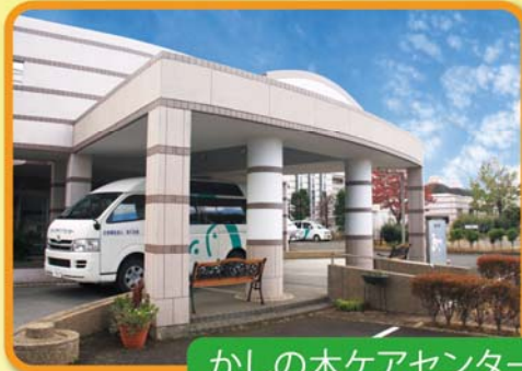
かしの木ケアセンター