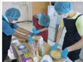
〔写真下〕調理実習風景