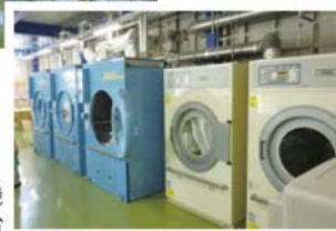
〔写真右〕業務用大型乾燥機 合計 5 台