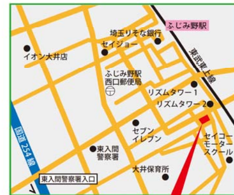
至めぐみ会 (すてっぷ)

ホームごとに主たる対象利用者を定め、利用者それぞれの個性を重視した支援を行います。 (すてっぷ・すてっぷⅡは知的障がい、精神障がいをお持ちの方、いっぽは身体障がいをお持ちの方) また、地域行事に積極的に参加し、地域住民としての責任を果たすとともに、地域に根付いた暮らしの実現を目指します。