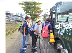
市バスで通っています。

障がいを持った人たちが自立を 目指し地域において必要なサービ スを受けながら共同して日常生活 を送るところです。 住宅地内の一般住宅やアパートで、 地域住民の皆さんと関わりながら 生活しています。