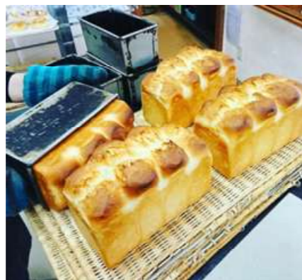
人気商品の食パン

障がいがあっても住み慣れた地域で「自分らしく働き、自分らしく生きること」に理念を置き、作業支援を中心に障害特性に応じた工夫や配慮を第一に考えた支援を心がけています。