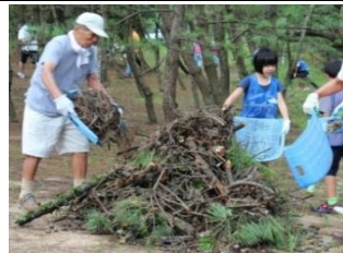
【枝・松ぼっくりひろい】