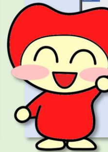
葦の家福祉会 イメージキャラクター わははあーと君