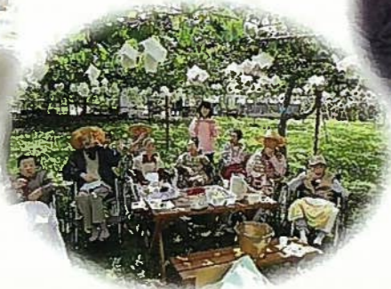
ぶどう棚の下で、秋を堪能