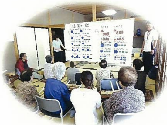
脳刺激プログラムの一場面

認知症を予防し、いつまでも住み慣れた地域で生活できるよう、セラピストや専門職員が知的機能の評価・脳刺激プログラムに基づき、脳の活性化を図ります。