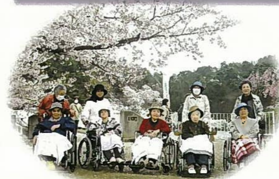
春らんまんの臥竜公園へ