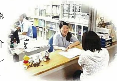
いつも明るい相談窓口

要介護又は、要支援認定者の自立支援の為、個々に応じた“各種介護サービス”の橋渡しやケアプランの策定、行政手続きの代行や連絡調整を行います。