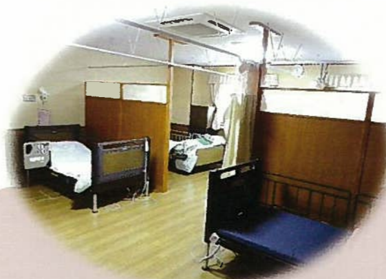
プライバシーに配慮した4人部屋

【事業の種類】短期入所生活介護 (多床室型) 【開設日】平成5年4月1日 【介護保険指定】平成11年12月27日 【事業者番号】長野県指定 2070700055 【定員】20名 【部屋タイプ】2人部屋、4人部屋 【利用対象者】「要介護」又は、「要支援」と認定された人 【申込方法】当施設相談員かケアマネージャーにご相談下さい。