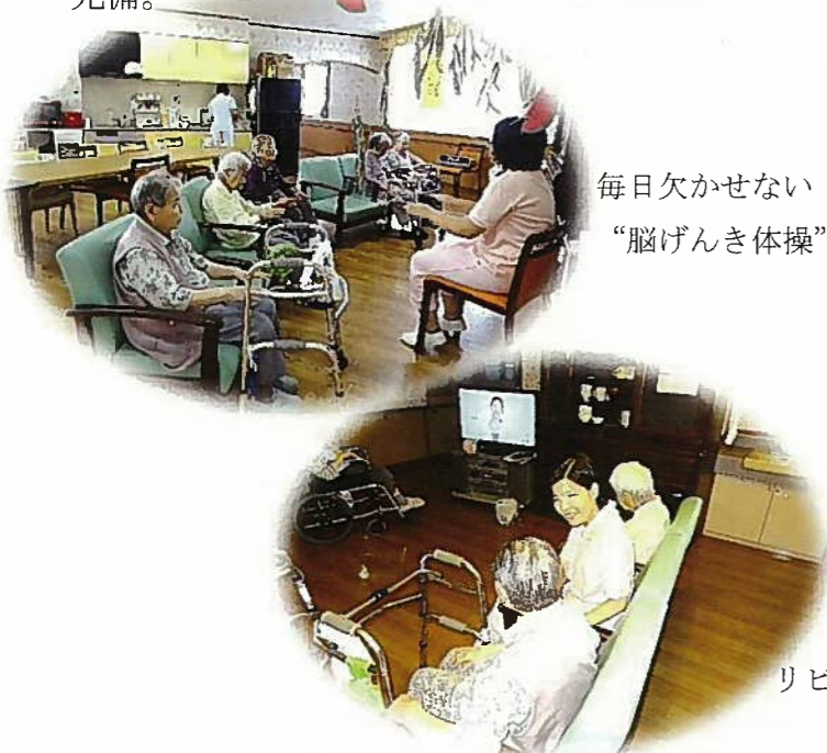
毎日欠かさない“脳げんき体操”

要介護又は、要支援2の認定を受けた地域の認知症高齢者が対象で、共同生活が可能な人。家庭的な雰囲気の中、介護士や看護職員、介護支援専門員らのスタッフが、生活相談や食事、排泄、入浴等の介護サービス面で日常生活を支援します。全室個室、冷暖房、スプリンクラー設備完備。