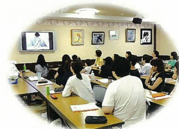
スクーリング風景

介護福祉士の取得には平成 28 年度から「実務者研修」の修了が義務化されました。 働きながら受験資格が取得 できるよう、 通信課程 で実務者研修講座を開講します。当医師や看護職員、介護支援専門員、介護福祉士等が懇切丁寧にご指導します。