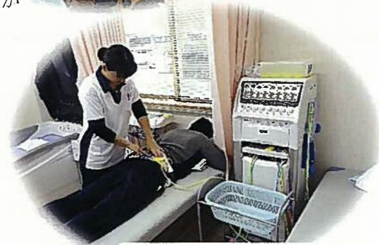
最新のリハビリ機器とセラピストによる治療が受けられます