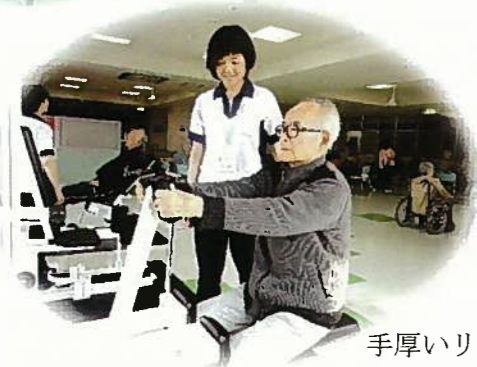
手厚いリハビリ体制