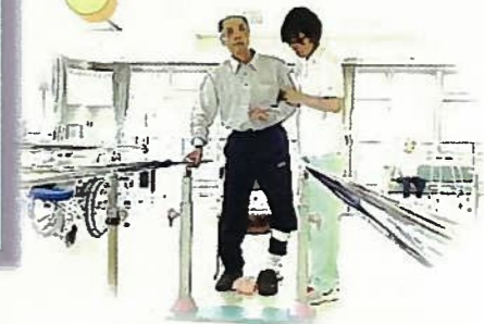
リハビリ室で 個別リハビリ

【事業の種類】 通所リハビリテーション 【開設日】 平成10年4月1日 【介護保険指定】 平成11年12月27日 【事業者番号】 長野県指定 2050780010 【定員】 35名 【利用対象者】 「要介護」又は、「要支援」と認定された人 【利用日】 月曜日～金曜日 【申込方法】 当施設相談員かケアマネージャーにご相談下さい。