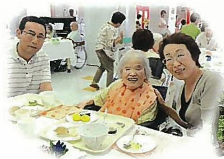
家族ふれあい“まごころデー”

【事業の種類】介護老人福祉施設 (特別養護老人ホーム) 【開設日】平成5年4月1日 【介護保険指定】平成11年12月27日 【事業者番号】長野県指定 2070700055 【定員】60名 【部屋タイプ】個室、2人部屋、4人部屋 【利用対象者】要介護3以上と認定された人 【申込方法】当施設相談員かケアマネージャーにご相談下さい。