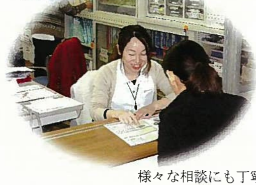
様々な相談にも丁寧に対応