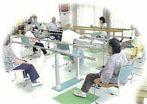
みんなでリハビリ体操