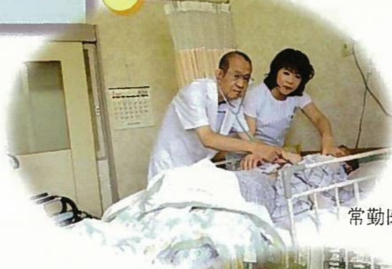
常勤医師による回診