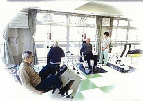
各種リハビリ マシンを完備

【事業の種類】 介護老人保健施設 【開設日】 平成10年4月1日 【介護保険指定】 平成11年12月27日 【事業者番号】 長野県指定 2050780010 【定員】 100名(ショートステイ含む) 【部屋タイプ】 2人部屋、4人部屋 【利用対象者】 「要介護」と認定された人 【申込方法】 当施設相談員かケアマネージャーにご相談下さい。