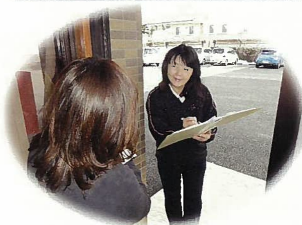
ご自宅への訪問もします