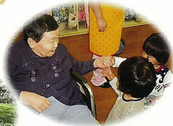
やすらぎ保育園児との交流