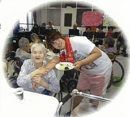
利用者と職員のふれあい