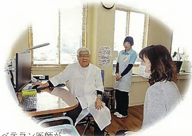
ベテラン医師が丁寧な診察

【事業の種類】無床診療所 【開設日・認可】平成28年8月1日 【診療科目】 整形外科、内科、外科 【診療日】月曜日から金曜日 ※祝日除く 【診療時間】午前8時45分から午前11時45分 午後2時30分から午後5時 【施設指定事項】 無料・低額診療事業 労災保険指定医療機関 生活保護指定医療機関 難病患者指定医療機関 【併設事業】訪問リハビリテーション