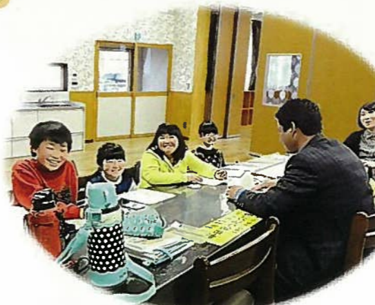
米国人職員による英会話指導