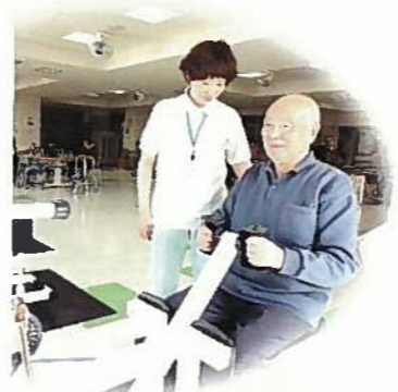
マシンリハビリも提供