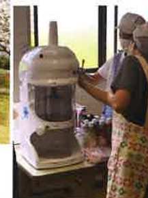
お楽しみ会 カキ氷