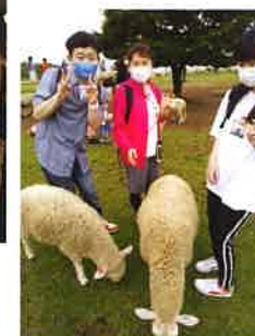
日帰り旅行 マザー牧場