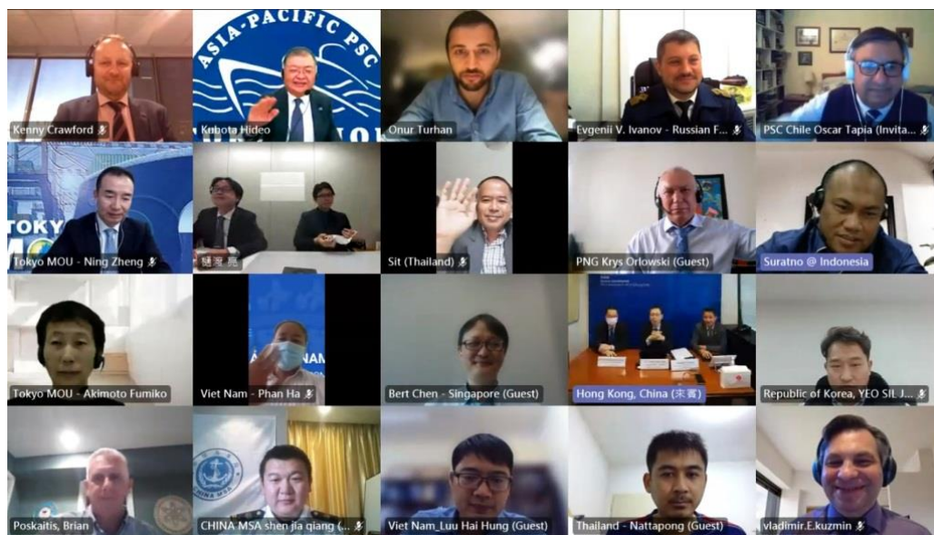
オンライン方式 (MS Teams) により開催した第31回PSC委員会

2020年度の事務局及びデータセンター(APCIS)の財政報告が行われ、長年に亘る日本財団の御支援に関し感謝の意が表明されました。