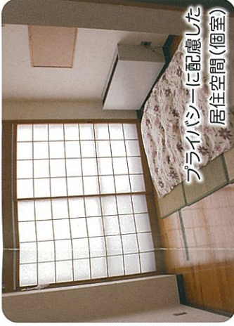
プライバシーに配慮した 居住空間(個室)