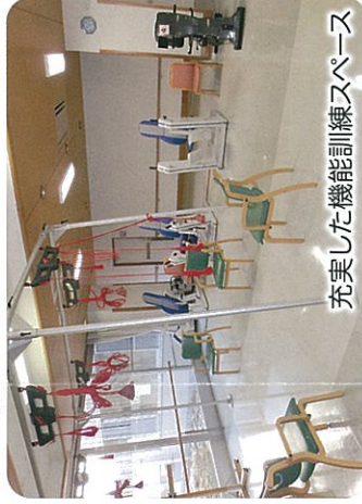
充実した機能訓練スペース