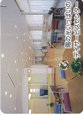
陽の光いっぱい デイサービスセンター