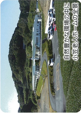
自然豊かな環境の中に 小笠老人ホームの全景