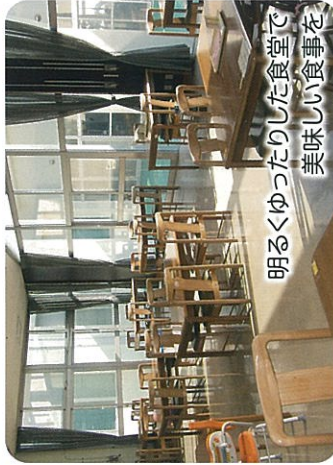
明るくゆったりとした食堂で 美味しい食事を