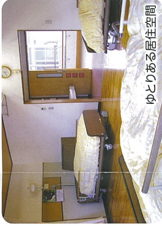
ゆとりある居住空間