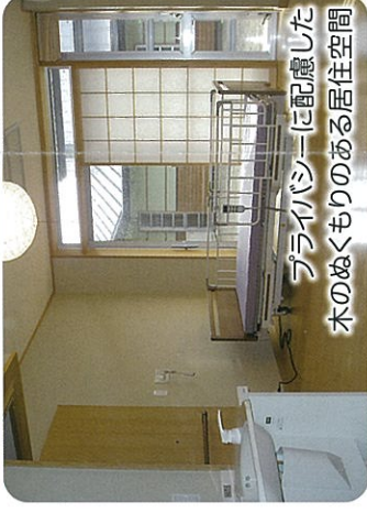
プライバシーに配慮した 木のぬくもりのある居住空間