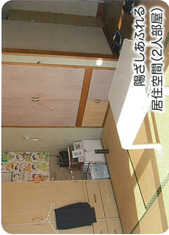
陽ざしあふれる 居住空間(2人部屋)