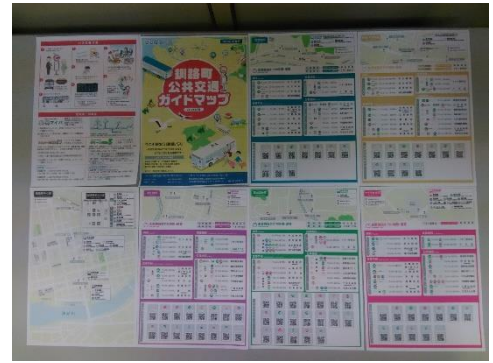
釧路町公共交通ガイドマップの表面