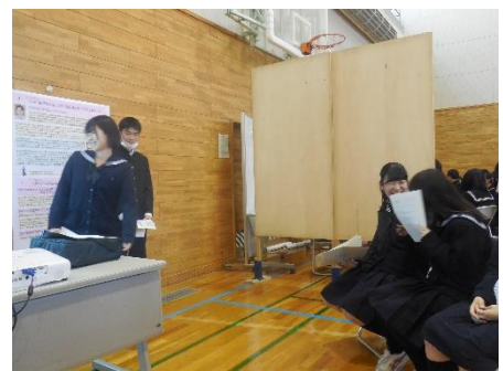
学術祭での発表の様子