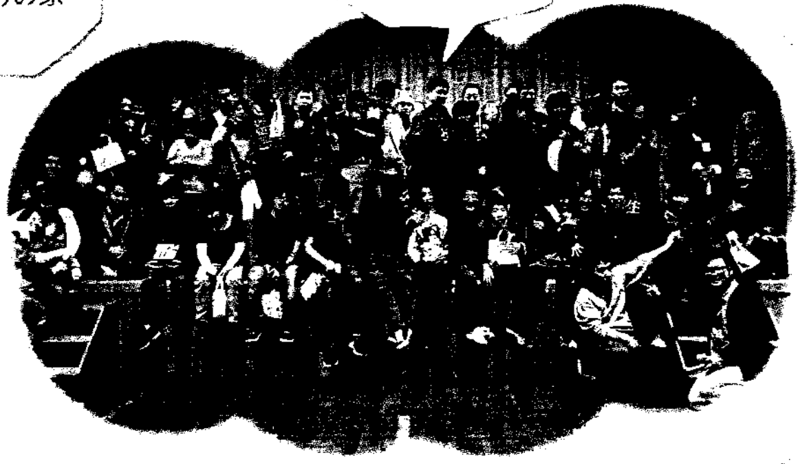
2012 OB クリスマス会