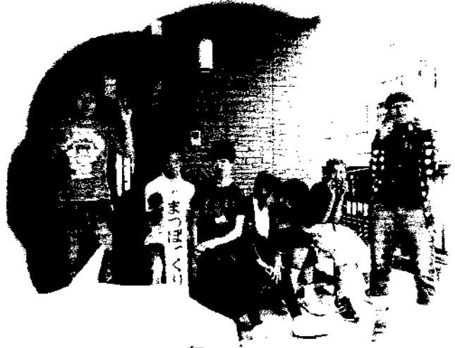
まつぼっくりの家