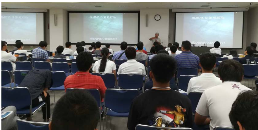
水中ロボットセミナー

東京海洋大学ロボット研究会 東京海洋大学 チームTOYAMA 富山県立滑川高等学校 海洋科 チームΔ-Y 富山県立富山工業高校 MARS 明治大学 東京工業大学ロボット技術研究会アクア研 東京工業大学 海洋科学高校 神奈川県立海洋科学高等学校 よこ 東京大学 小山工業高等専門学校田中研 小山工業高等専門学校 豊橋技科大コンピュータクラブ 豊橋技術科学大学 チームひとり 千葉工業大学 東工大附属 12 期機械科干潟ロボット製作チーム 東京工業大学附属科学技術高等学校 コバンザメと私 デジタルハリウッド大学院