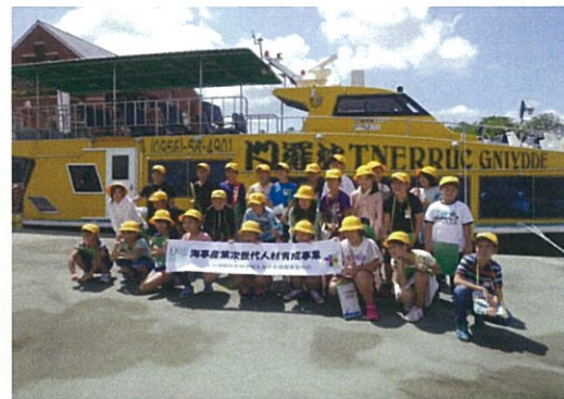
船の前で記念撮影②(クルーズ乗船後)