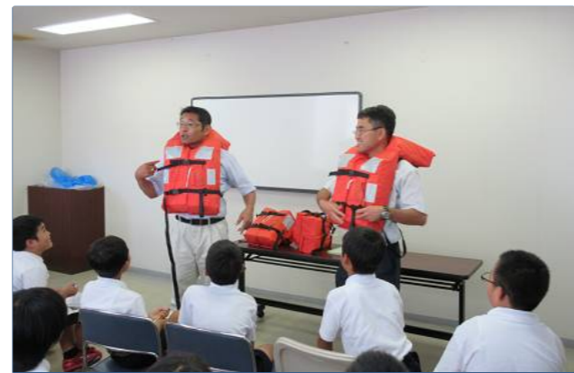
ちなみに、先生も着用体験