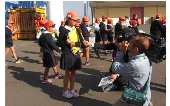
RKK熊本放送のインタビュー