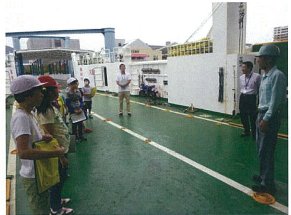
「フェリーみしま」の船内見学