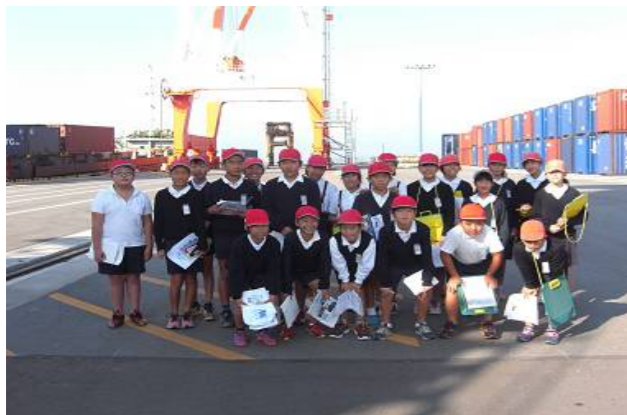
ヤード内で記念写真