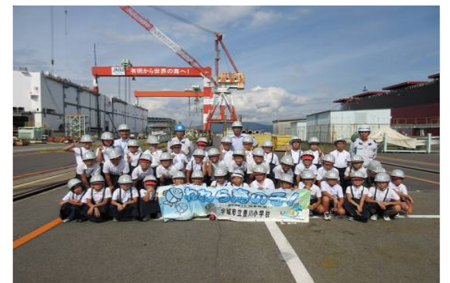
造船所で記念写真