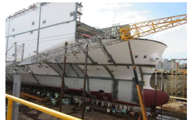
みんなが見学した自動車運搬船