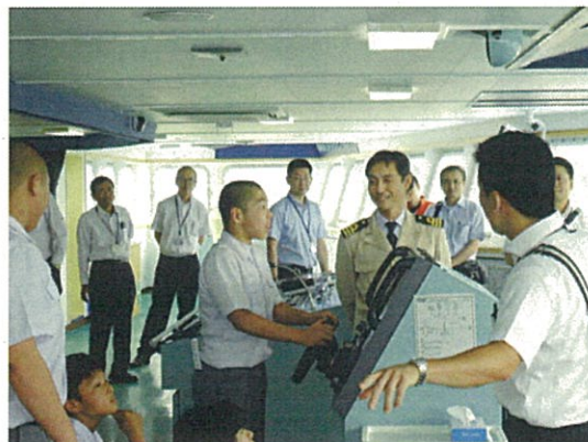
航海士よりレクチャー