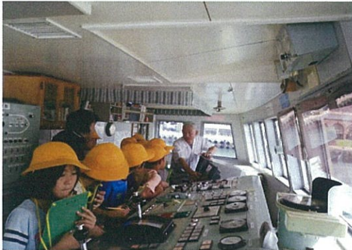
「機械がいっぱい」その役割を学んでいます。