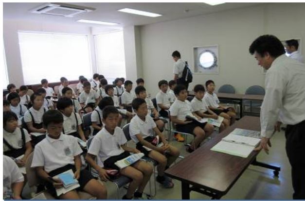
有明フェリーでの勉強風景