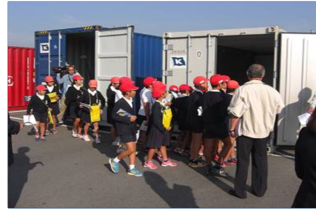
コンテナの中ってこうなってるんだあ