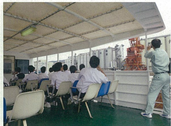
海上から色々な海事施設を間近に見学