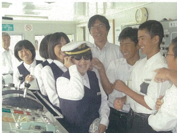
私が女性船長の〇〇です。