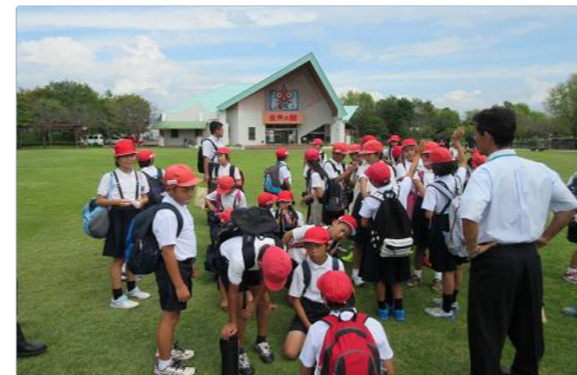
昼ご飯ちゃんと食べたかな