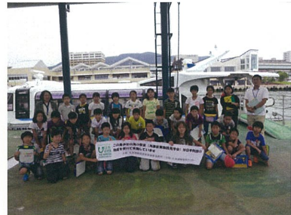
「ドリームせがわ」の前で記念撮影②