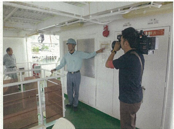
ここにも救命胴衣が入ってます！