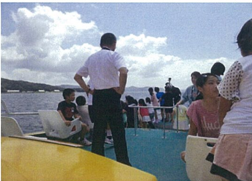
佐世保港クルーズの様子