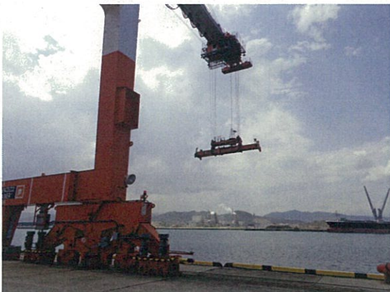
荷役デモンストレーション