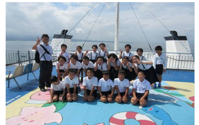
有明みらいの船内見学