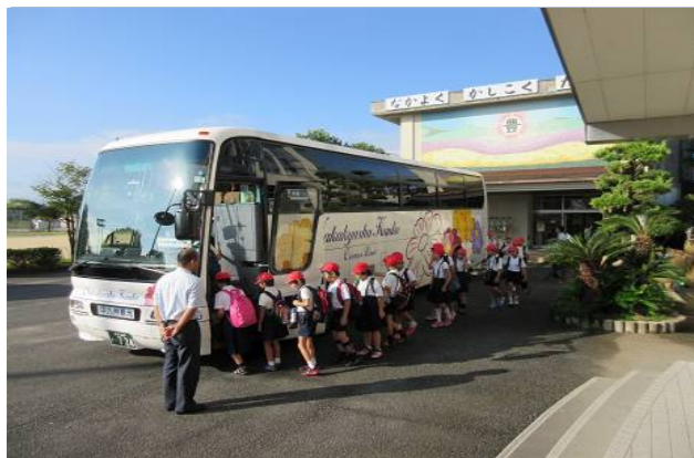
このバスで海事教室へ移動