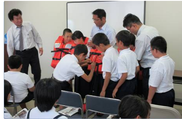
いざという時の救命胴衣着用体験