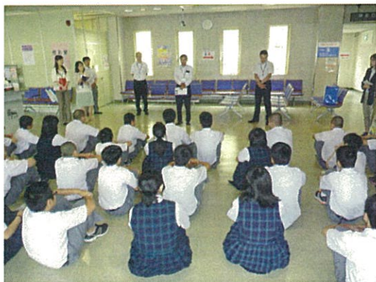
阪九フェリーの担当者より説明