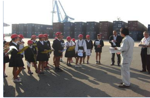
熊本港コンテナターミナルで物流を学ぶ