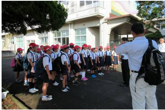
出発前の注意事項連絡