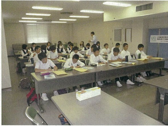
見学の前に：最近では女性の船員さんも・・・