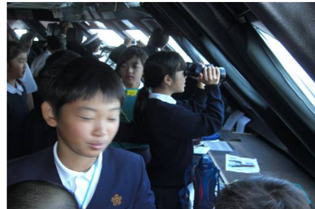
オーシャンアローで見張り体験