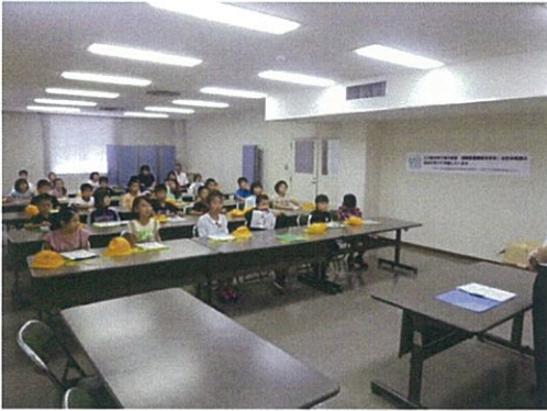
見学の前に予習勉強をしましょう！