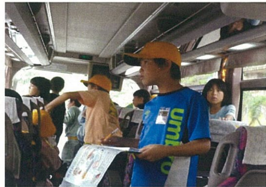
S S Kの施設を目に焼き付けています