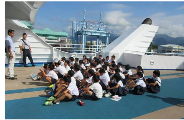
オーシャンアロー船上見学