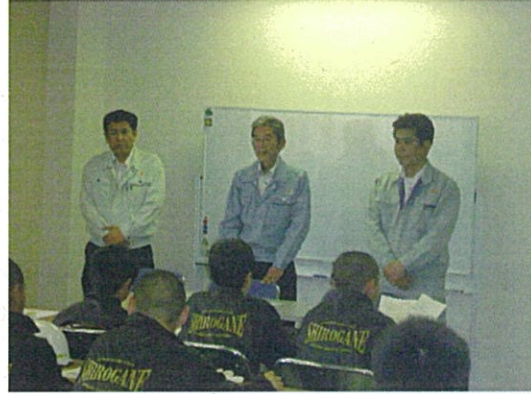
マルイ運輸所長より概要説明