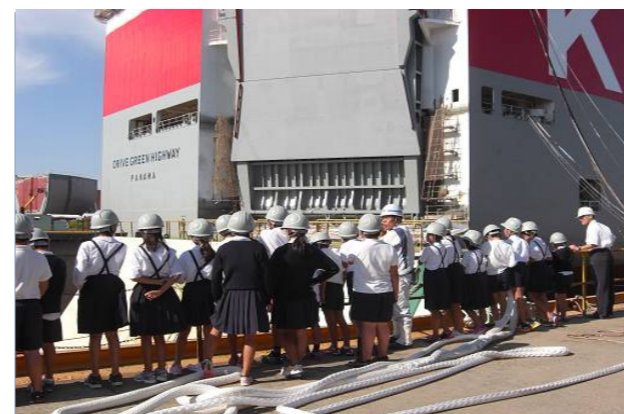
これが自動車運搬船だよ