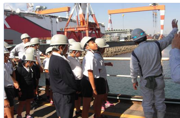
巨大船を見上げる