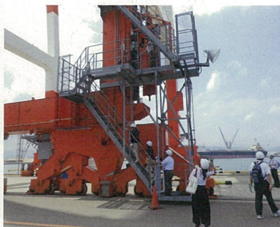
北部港湾事務所職員による出前講座