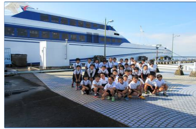
熊本港 オーシャンアローをお出迎え