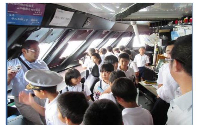
普段立ち入れないブリッジ見学