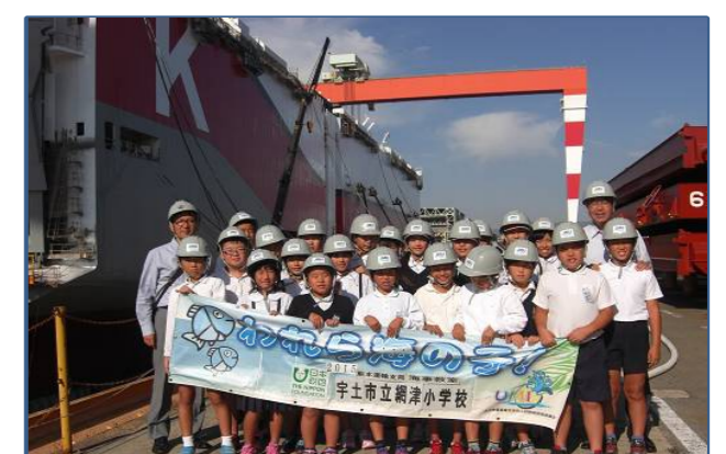
自動車運搬船をバックに記念写真