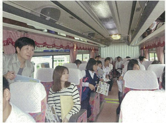
先生も積極的に造船の現場を見学！