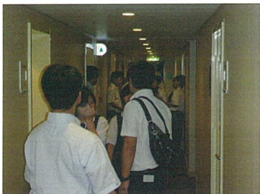
豪華な客室を見学