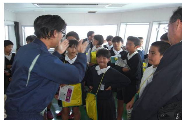
有明きぼうブリッジで勉強