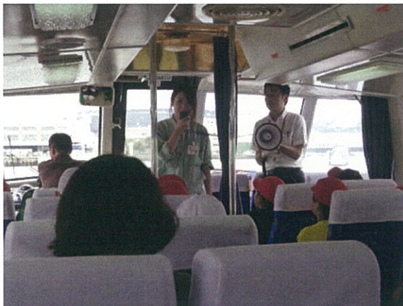
佐世保港内クルーズ中に港の歴史・役割を説明