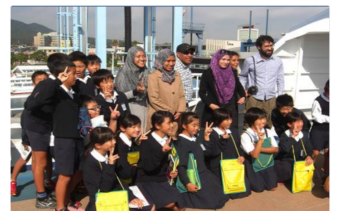
乗り合わせた外国旅行者と記念写真