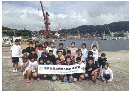
S S Kで記念撮影①