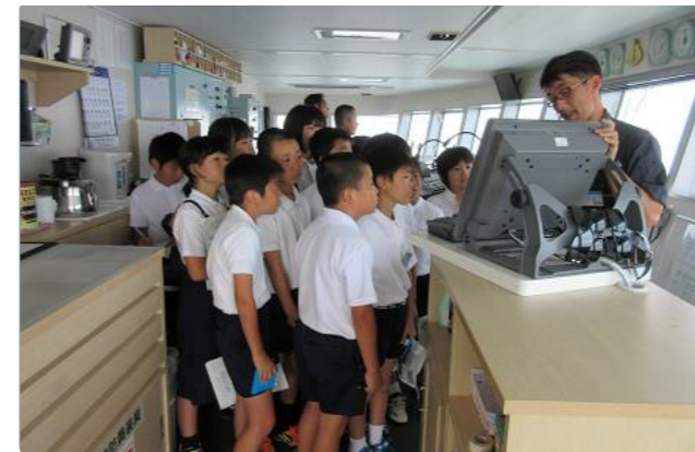
有明みらいのブリッジ見学