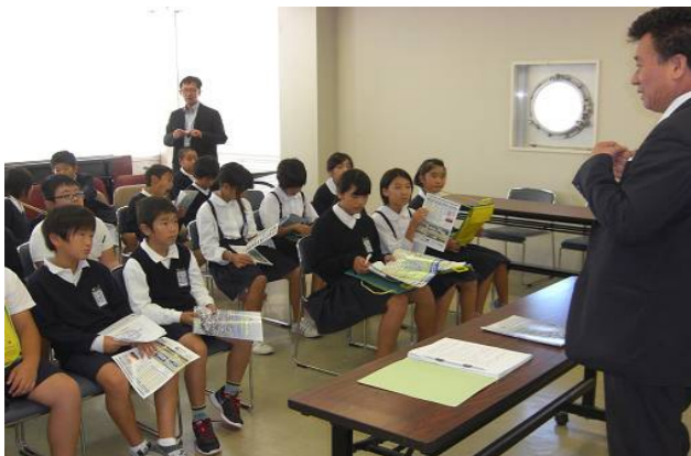
有明フェリー事務所で座学