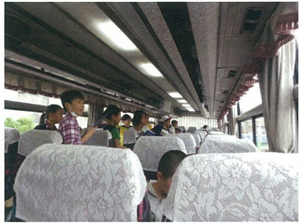
ここは、第5ドック、長さが175mです！