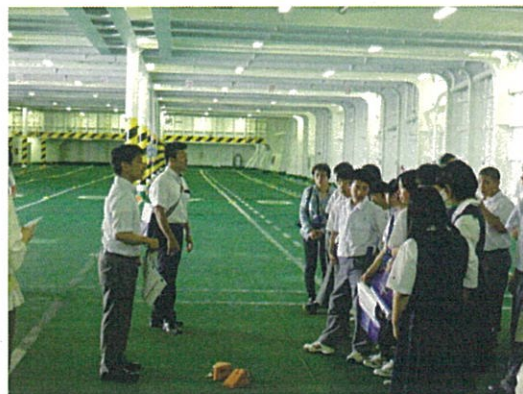
カーデッキでの積込の説明