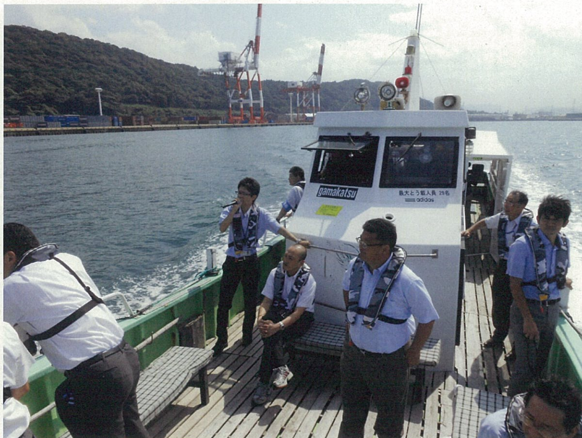
北部港湾事務所職員による細島港の説明