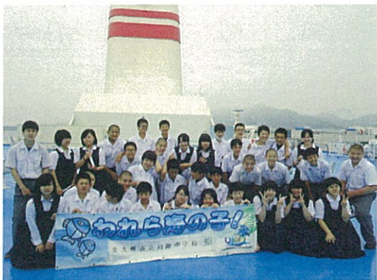
スカイデッキで集合写真