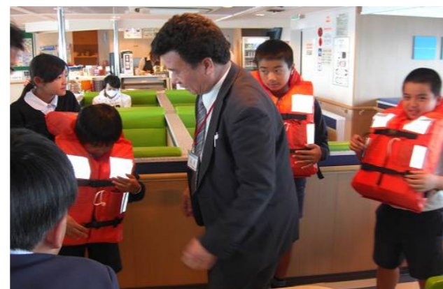
有明きぼう船内で救命胴衣着用体験