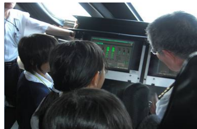
オーシャンアローのブリッジ