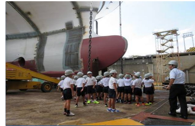
ドック底での勉強