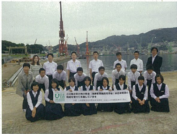
S S Kをバックに記念撮影