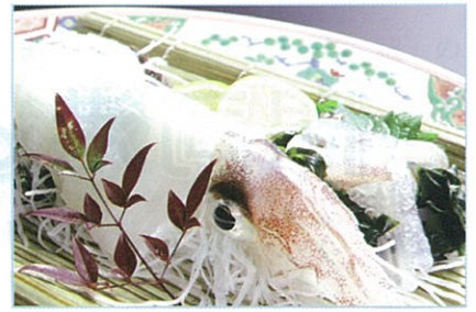
下関北浦特牛イカ