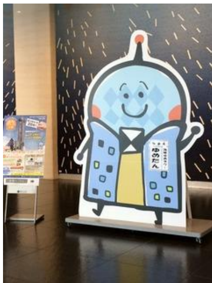
左:海峡ゆめタワーの「ゆめたん」 下:パネル展示