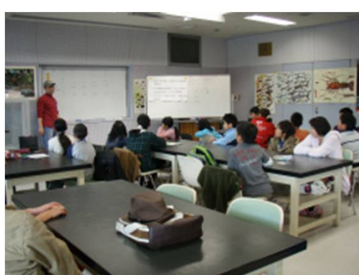
MAREの実践 愛媛県・愛媛県立総合科学博物館