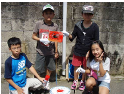
「この先、海です。プロジェクト」 埼玉県・入間市青少年活動センター