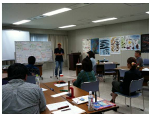
MAREリーダー養成ワークショップ 大阪府・パル法円坂