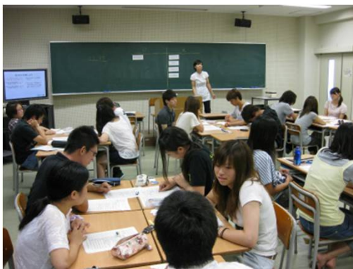
科学コミュニケーション実践講座 三重県・エネルギー、環境研究会