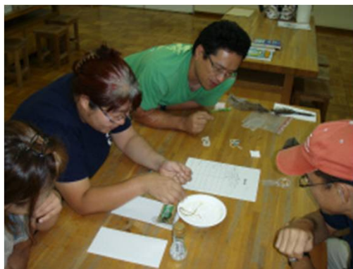
MAREリーダー養成ワークショップ 北海道・札幌かでの