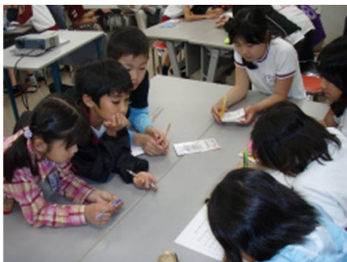
MAREの実践 千葉県・長者小学校