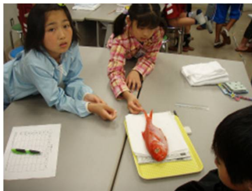
MAREの実践 埼玉県・入間市青少年活動センター