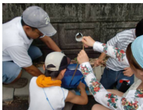
「この先、海です。プロジェクト」 宮城県・伊里前小学校