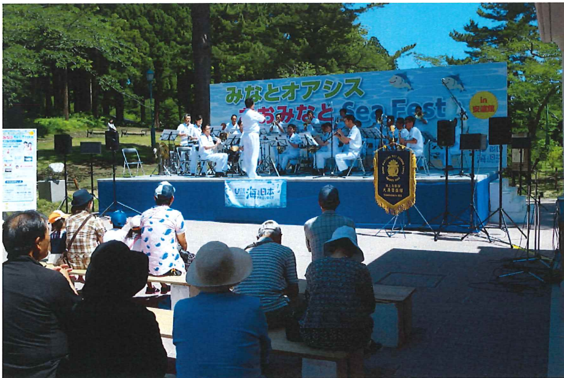
海上自衛隊大湊音楽隊による演奏。「海」をテーマとし、幅広い年代が楽しめる楽曲を披露してくれた。