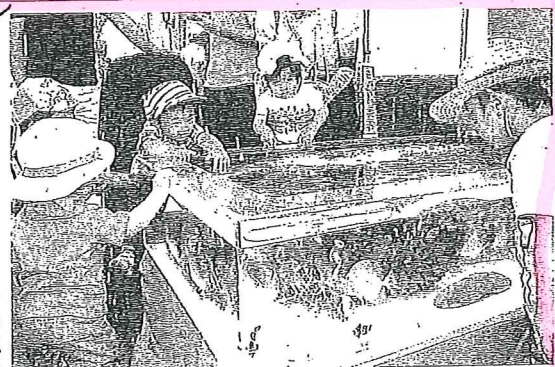
移動水族館で、かわいらしい熱帯魚などを見て喜ぶ子どもたち