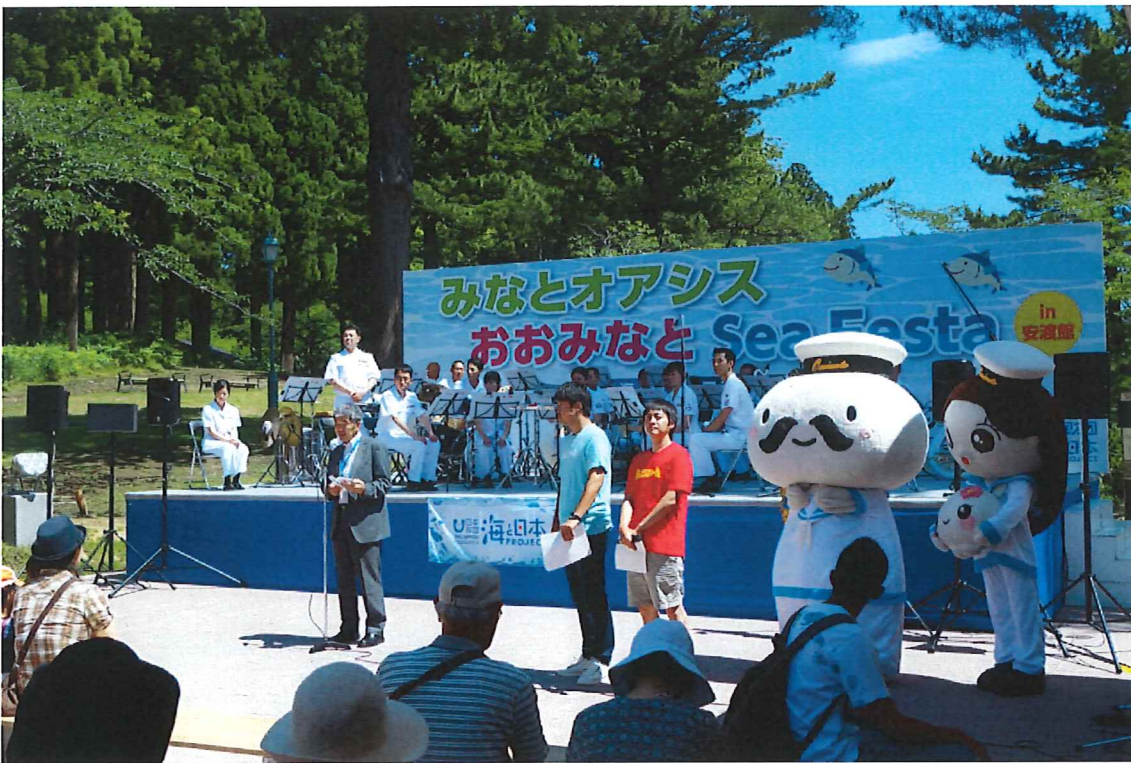
オープニングにはむつ市PRキャラクターであるムチュランファミリーが出演し、会場を賑わせた。