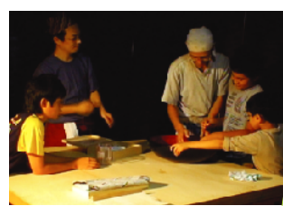
世界の共食を体験する

会 費：20,000円(3泊4日)／7,000円(1日毎の参加)／6,000円(日帰りの参加)