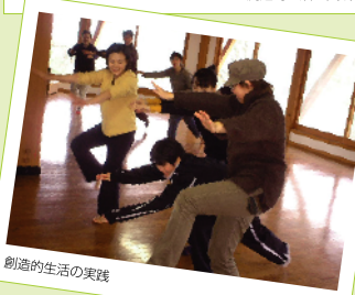
創造的生涯の実践