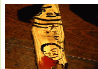
創造的生涯の実践