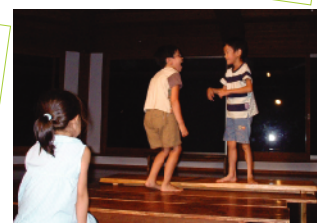
創造的生涯の実践