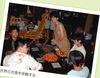
世界の共食を体験する