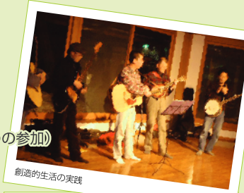
創造的生涯の実践