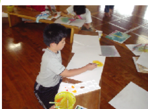
創造的生涯の実践