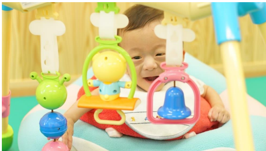
大好きなベビージム！