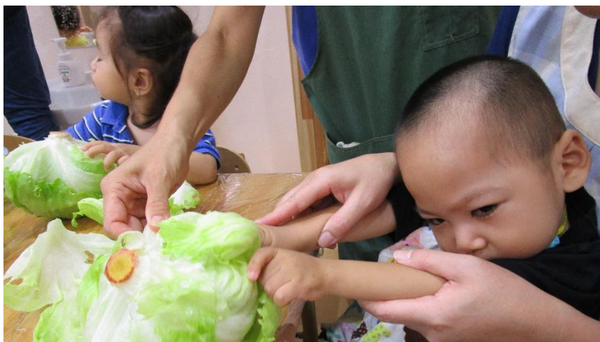
おうち保育園のお友達と一緒に レタスちぎり遊び

子ども達が相互に発達を寄与する保育園 ～子どもが子どもの中ですくすくと育つ～ インクルーシブ保育をこれからも実践して いきます。