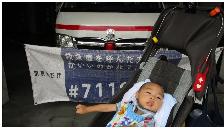
大好きな消防車と一緒にハイポーズ！