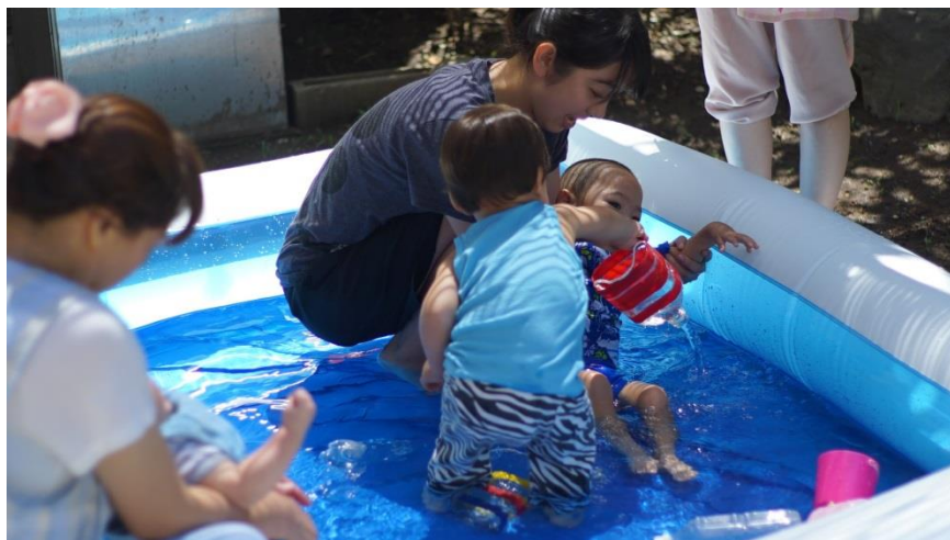
両園の園児が一緒になって園庭で水遊び