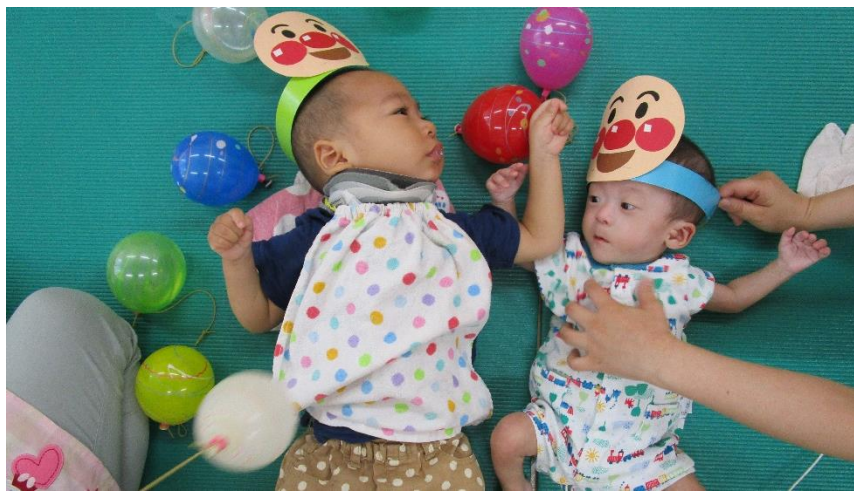
アンパンマンダンスを踊ろう～♪