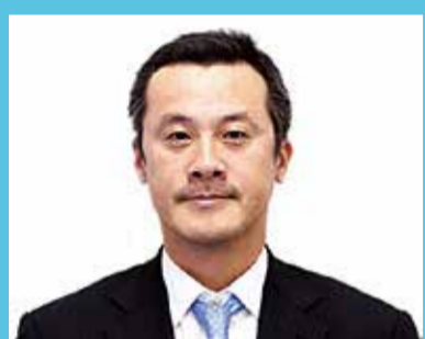
堺プレイヤーズ 中垣内祐一

元全日本男子バレーボール代表・中垣内祐一氏も トップアスリートたちとの交流イベント