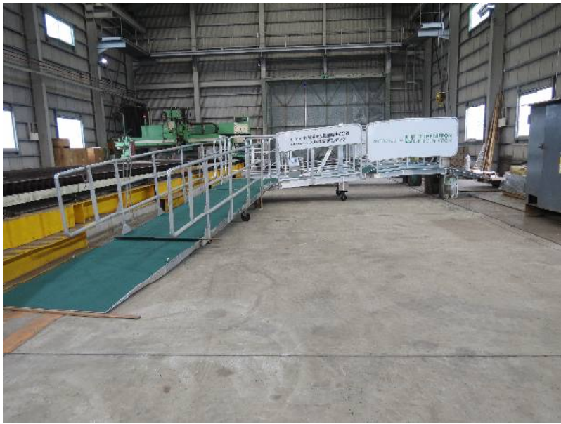
バリアフリー対応型タラップ 種子屋久高速船(株)向け 2基 L5590×W1100×H 560 mm