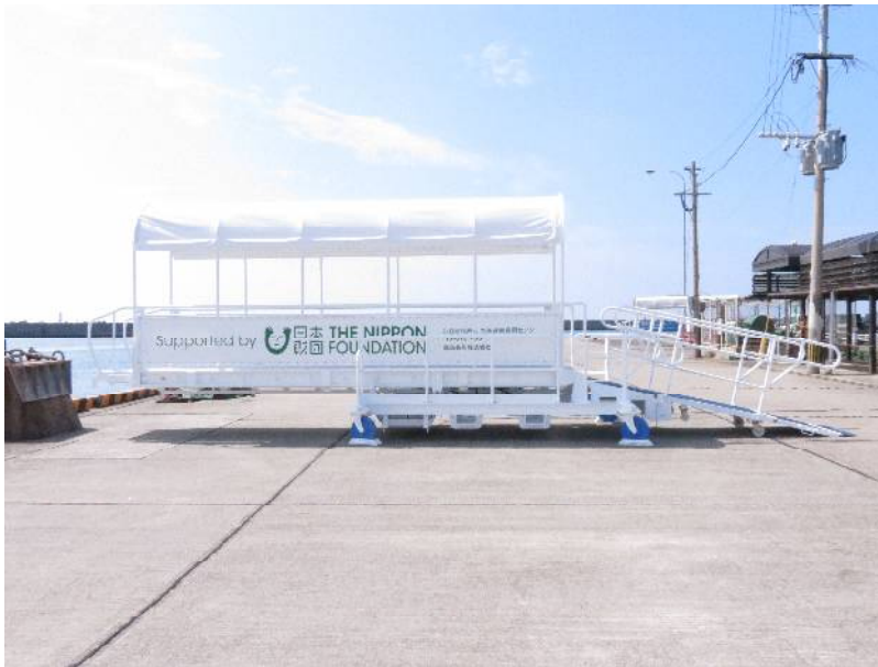
バリアフリー対応型タラップ 甌島商船(株)向け 1基 L9100×W2000× H最低 850/最高 3400 mm