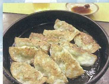
左上：戸畑チャンポン 中：関門のふぐ 右下：八幡ぎょうざ 表紙：若戸大橋