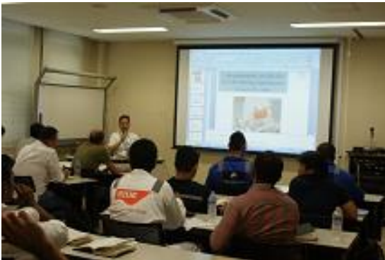
研修会 (H28. 8. 23, 24)