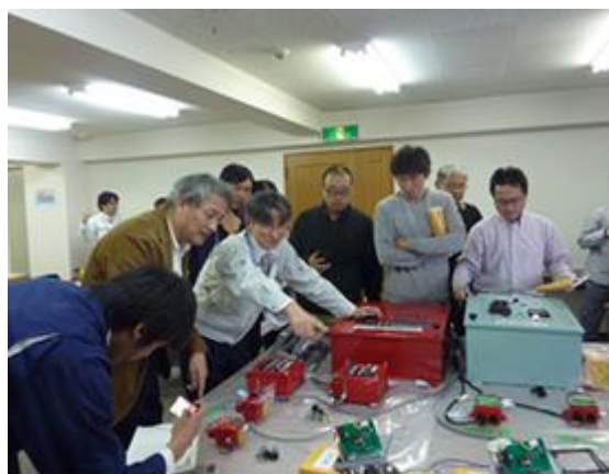
実技講習の様子（ヤマトプロテック㈱）