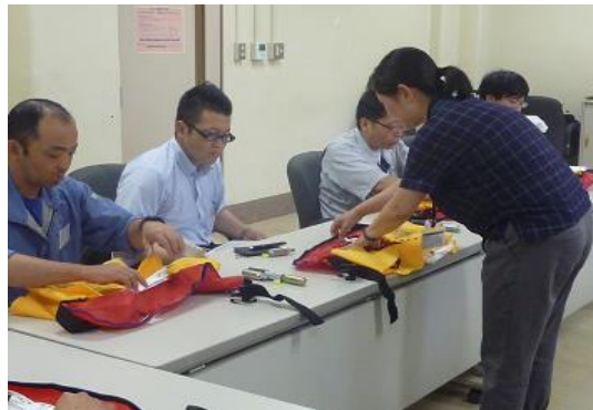
実技講習（折畳みの説明）