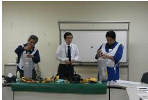
実技講習（個人装具）