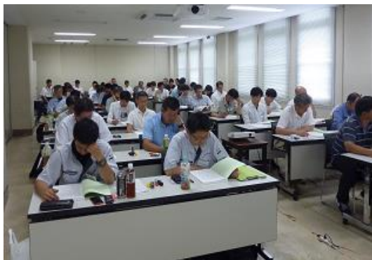
学科講習（整備要領説明）