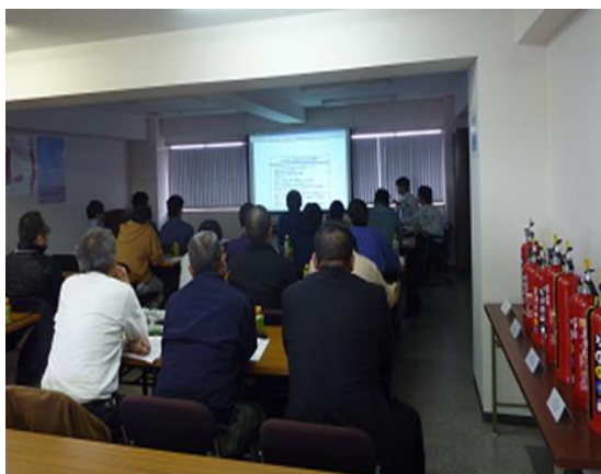
座学講習の様子（ヤマトプロテック㈱）