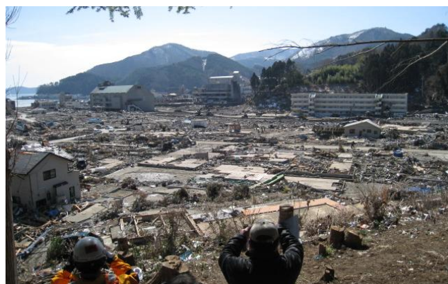
高台から見た女川町の風景

保健師さんの亡くなった息子さんは、当時はまだ安置所に安置されており、本来ならば母親として亡き息子さんの傍にひと時も離れずにいたいであろうと思われましたが、親という私的な思いよりも保健師としての公人の立場で地域の被災者のために必死に活動されている姿勢に、ただただ胸が詰まり、平伏する思いでした。(宮地雅 記)