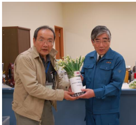
石巻市長へ水仙の花贈呈