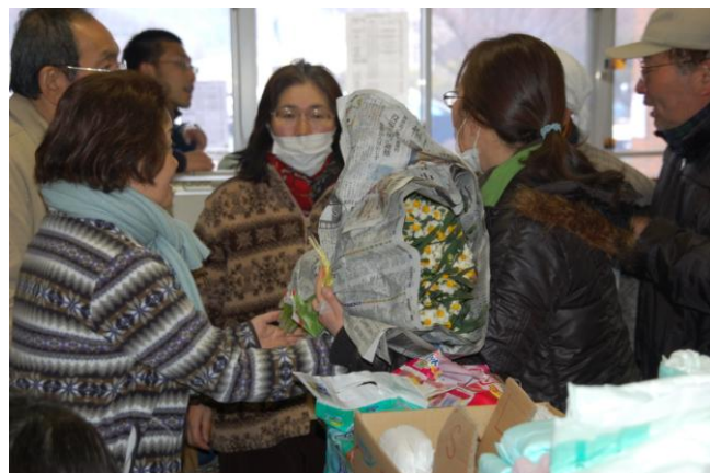
女川町避難所にて