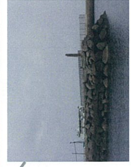
現役の石積の岸壁