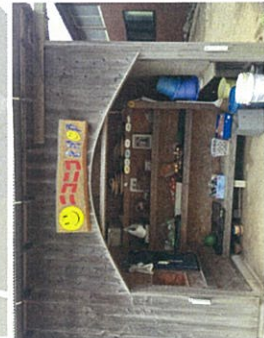
島の百円ショップ