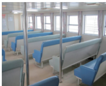
3 F 船室