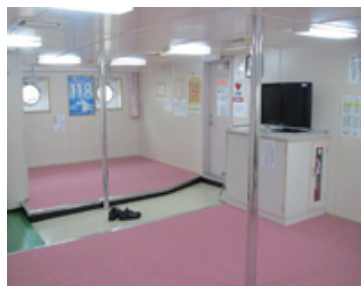
1 F 船室