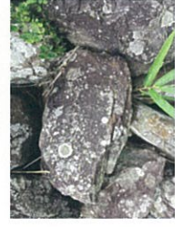
石垣の中には亀がいるかも