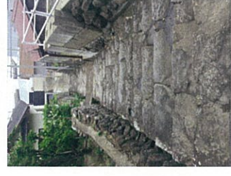
美しい石段から眺める海