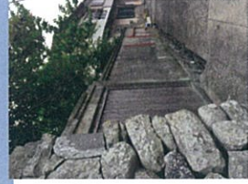
石垣が美しい島一番のお宅