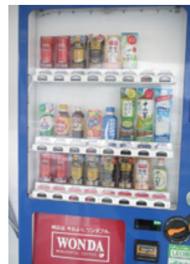
自販機もあります