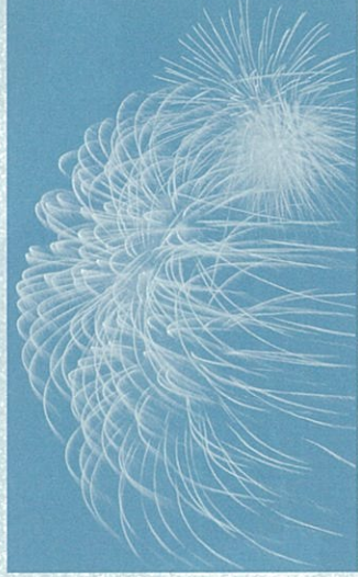
平戸港夏祭りの花火、2300発を船から鑑賞します。目の前の海上からあがる花火は圧感!

※ 天候による内容の変更、または中止の場合には、参加者へ事前にご連絡いたします。