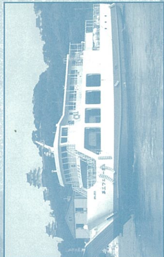
フェリーで平戸の島々を巡ります