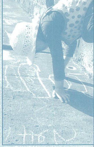
船をキャンバスに自由に描きます。