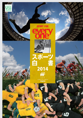
2014年3月1日発売／A4判／252ページ 3,500円+消費税