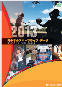
2014年3月1日発売 A4判／200ページ 2,000円+消費税