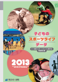
2014年3月1日発売 A4判／136ページ 2,000円+消費税